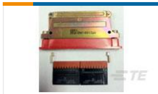
TE 产品编号244114-000 MTCPK2PJC22SS