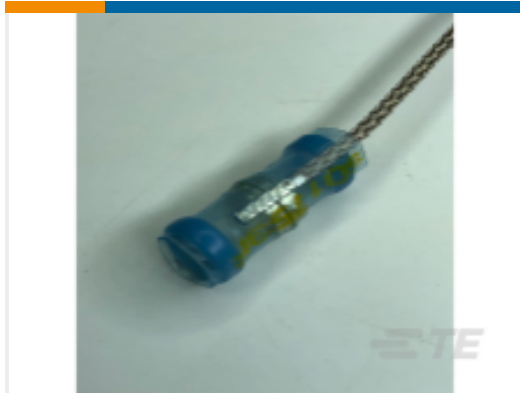
TE 产品编号209036-001 SO63-4-W1-24-9-100CS2870