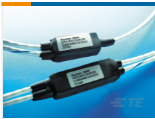
TE 产品编号401927-000 D-500-0457-3-613-078