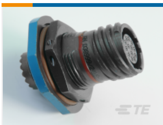
TE 产品编号YACT24MA98SNV00100 JAM NUT RECEPTACLE