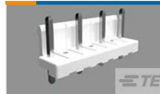
TE 产品编号4-1123724-5 3.96EP HDR ASSY 5(9)P RED