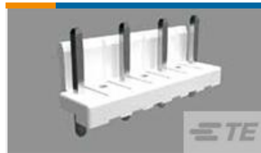
TE 产品编号7-1123724-4 EP CONN.HDR ASSY 4/7P GRAY (NO. 2,4,6 POS