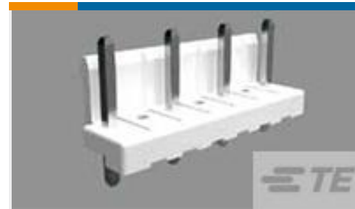
TE 产品编号3-1123724-4 3.96EP HDR ASSY 4(7)P BLUE