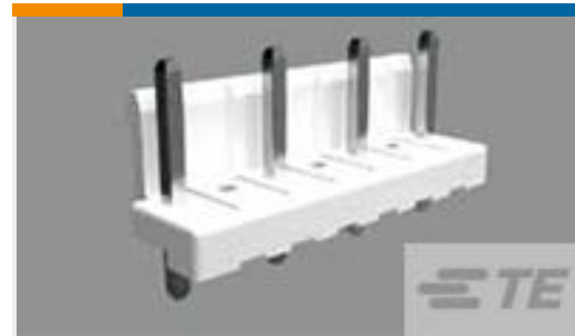
TE 产品编号2-1123724-4 3.96EP HDR ASSY 4(7)P YELLOW