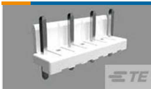
TE 产品编号6-1123724-4 3.96EP HDR ASSY 4(7)P GREEN