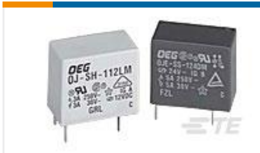
TE 产品编号8-1419128-1 OJ-SH-105LMH,000