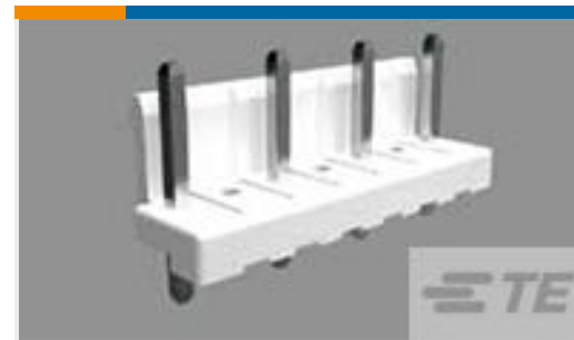
TE 产品编号9-1123724-4 EP CONN.HDR ASSY 4/7P ORANGE (NO.2,4,6 P