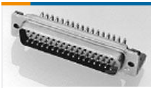
TE 产品编号1218440-5 AMPLIMITE,ASY,PLUG,RT ANG,109,5