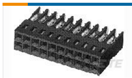
TE 产品编号102448-8 20 AMPMODU MT ASSY DR .100CL