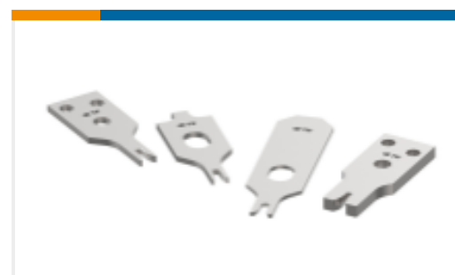
CRIMPER REPRESENTATION ONLY