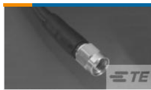
TE 产品编号1051639-1 2031 5002 02