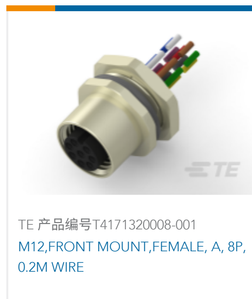
TE 产品编号T4171320008-001 M12,FRONT MOUNT,FEMALE, A, 8P, 0.2M WIRE