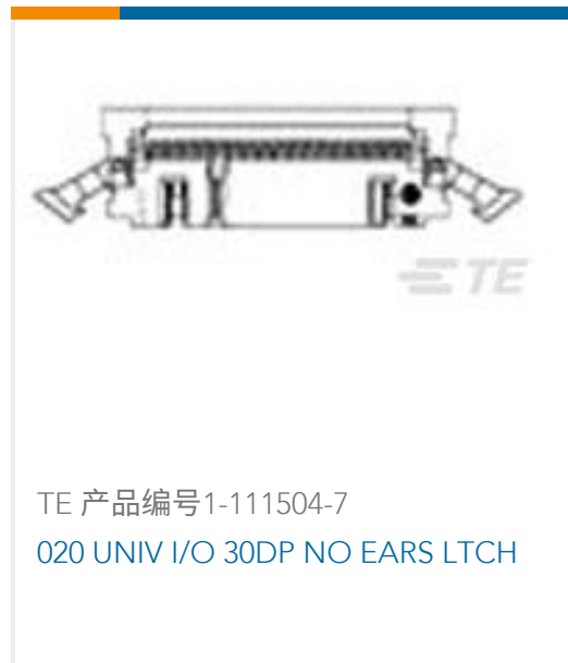
TE 产品编号1-111504-7 020 UNIV I/O 30DP NO EARS LTCH