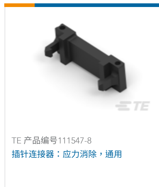
TE 产品编号111547-8 插针连接器：应力消除，通用