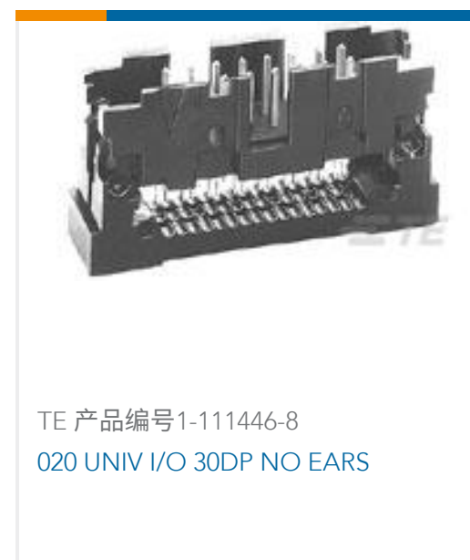
TE 产品编号1-111446-8 020 UNIV I/O 30DP NO EARS