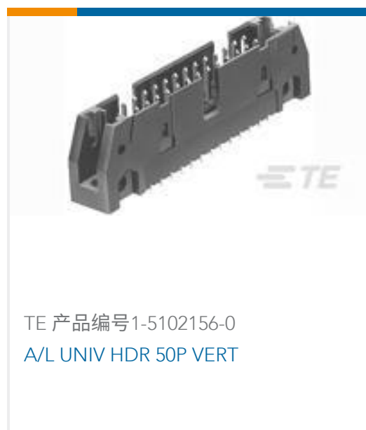
TE 产品编号1-5102156-0 A/L UNIV HDR 50P VERT