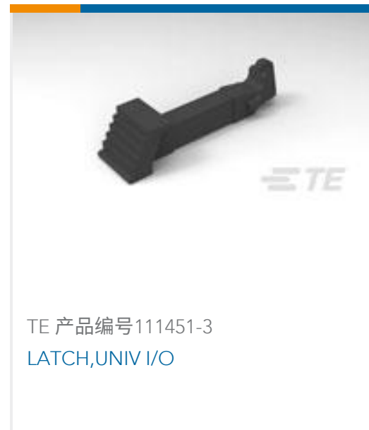
TE 产品编号111451-3 LATCH,UNIV I/O