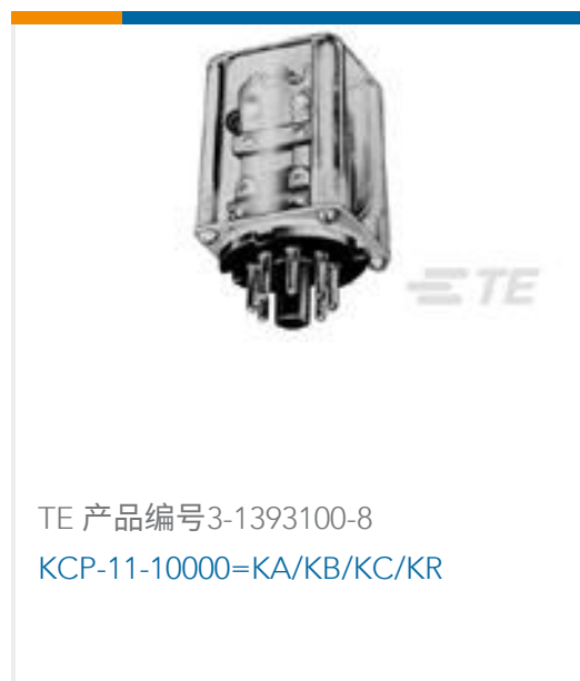
TE 产品编号3-1393100-8 KCP-11-10000=KA/KB/KC/KR