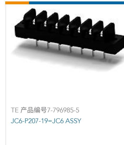
TE 产品编号7-796985-5 JC6-P207-19=JC6 ASSY