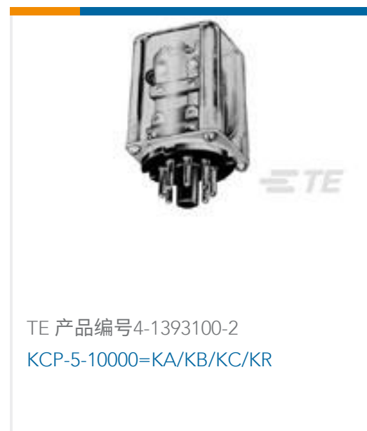
TE 产品编号4-1393100-2 KCP-5-10000=KA/KB/KC/KR