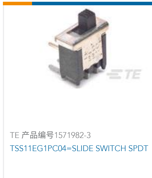
TE 产品编号1571982-3 TSS11EG1PC04=SLIDE SWITCH SPDT