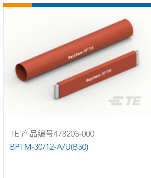
TE 产品编号478203-000 BPTM-30/12-A/U(B50)