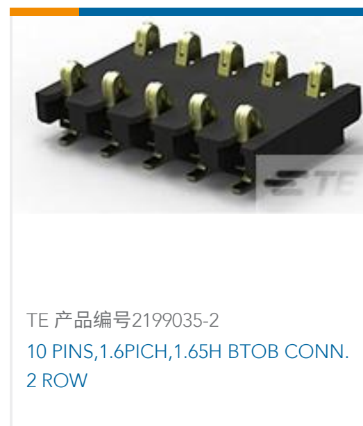
TE 产品编号2199035-2 10 PINS,1.6PICH,1.65H BTOB CONN. 2 ROW