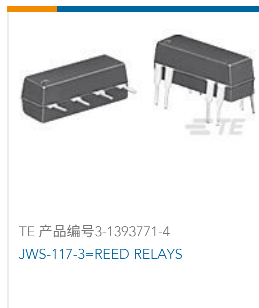
TE 产品编号3-1393771-4 JWS-117-3=REED RELAYS