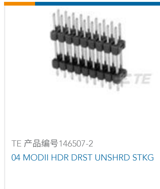
TE 产品编号146507-2 04 MODII HDR DRST UNSHRD STKG