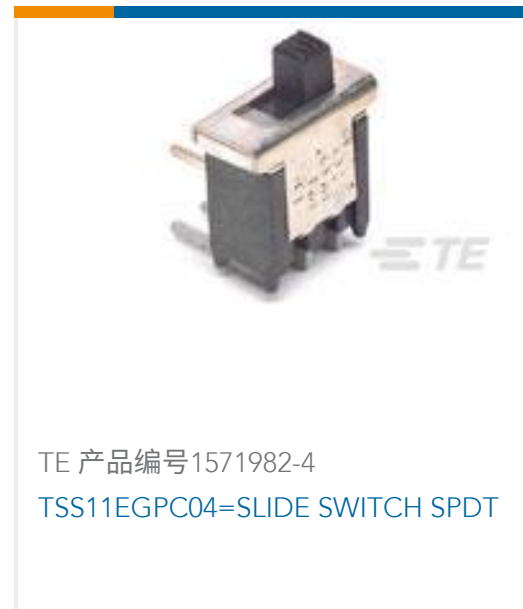
TE 产品编号1571982-4 TSS11EGPC04=SLIDE SWITCH SPDT