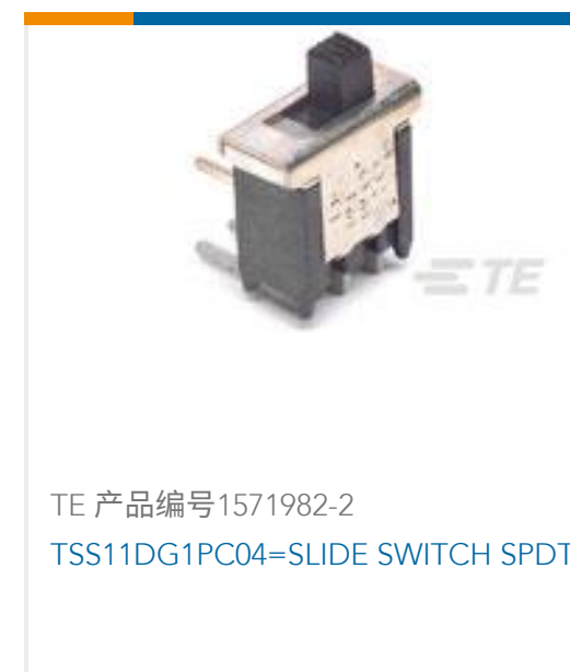
TE 产品编号1571982-2 TSS11DG1PC04=SLIDE SWITCH SPDT