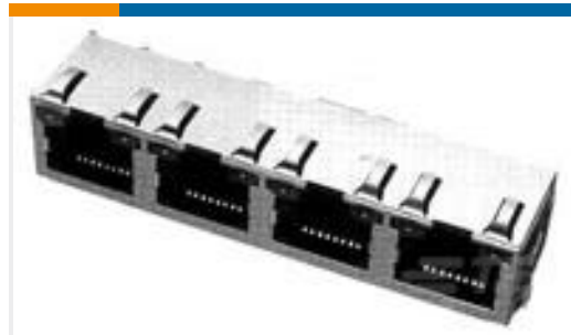
TE 产品编号1-5406552-7 INV MJ,1X4,PNL GRD,LED (-/G) W