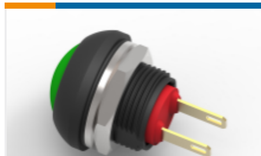
TE 产品编号1-2329360-4 PB OFF/ON RC GRE M3 TERM. IP68