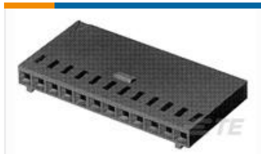
TE 产品编号86426-7 05 MODIV HSG COMP SR .100CL