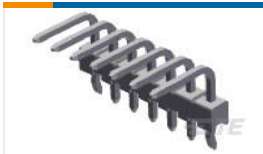
TE 产品编号3-644694-7 07P MTA100 R/A HDR RETENTIVE