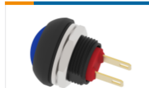
TE 产品编号1-2329360-5 PB OFF/ON RC BLU M3 TERM. IP68