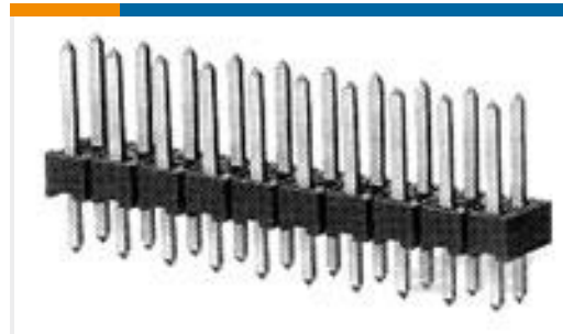
TE 产品编号103322-7 14 MODII HDR DRST B/A .100CL