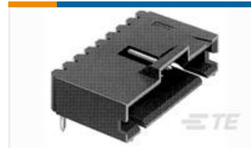
TE 产品编号103635-6 07 MTE HDR SRRA LATCH .100CL