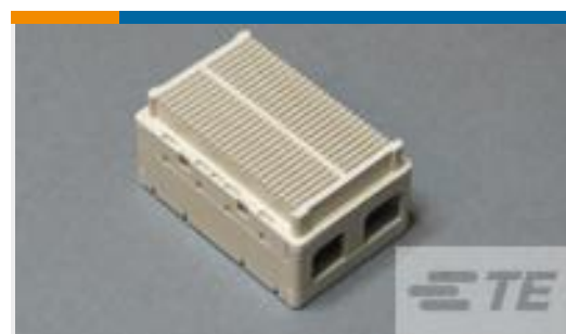
TE 产品编号 6-1761615-1 STEP-Z RCPT 11MM 200P LF ST