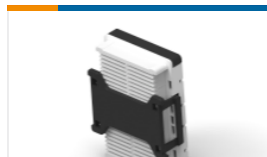
TE 产品编号 6-1761615-5 STEP-Z RCPT 15MM 200P LF ST