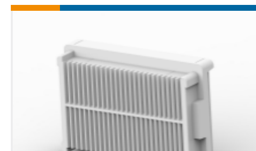
TE 产品编号 3-1761615-1 STEP-Z RCPT 05MM 200/104P PB S