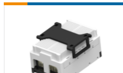
TE 产品编号 5-1761615-5 STEP-Z RCPT 05MM 200P LF ST