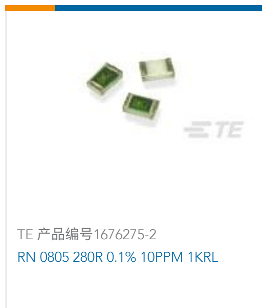
TE 产品编号1676275-2 RN 0805 280R 0.1% 10PPM 1KRL