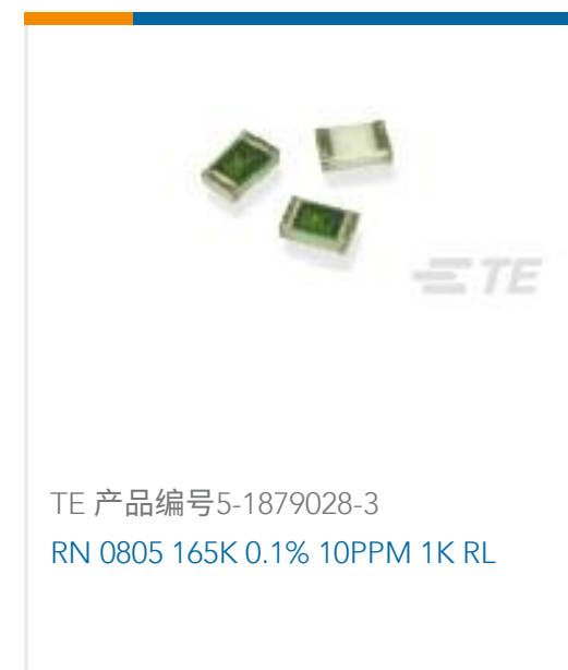
TE 产品编号5-1879028-3 RN 0805 165K 0.1% 10PPM 1K RL