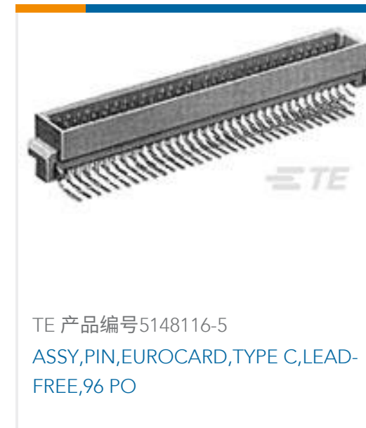
TE 产品编号5148116-5 ASSY, PIN, EUROCARD, TYPE C, LEAD-FREE, 96 PO