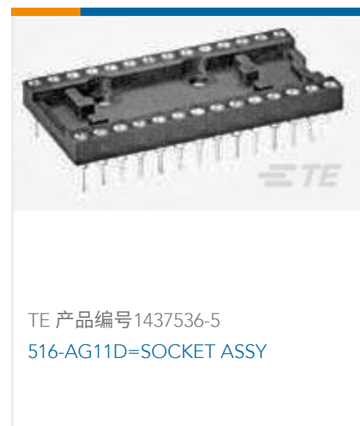
TE 产品编号1437536-5 516-AG11D=SOCKET ASSY