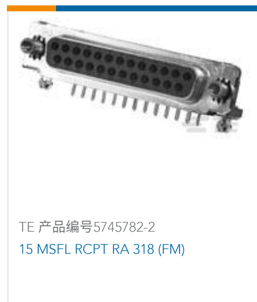
TE 产品编号5745782-2 15 MSFL RCPT RA 318 (FM)