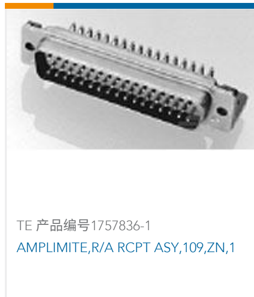
TE 产品编号1757836-1 AMPLIMITE, R/A RCPT ASY, 109, ZN, 1