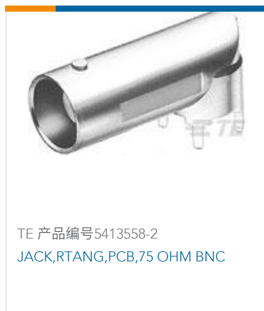
TE 产品编号5413558-2 JACK,RTANG,PCB,75 OHM BNC