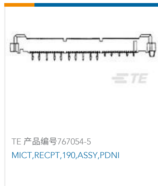
TE 产品编号767054-5 MICT, RECPT, 190, ASSY, PDNI