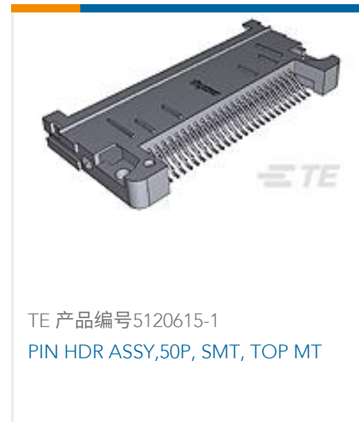
TE 产品编号5120615-1 PIN HDR ASSY, 50P, SMT, TOP MT