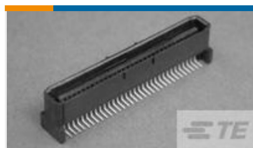
TE 产品编号5146888-2 1FHP,84,30A/S,S,C,S10,12,13,15