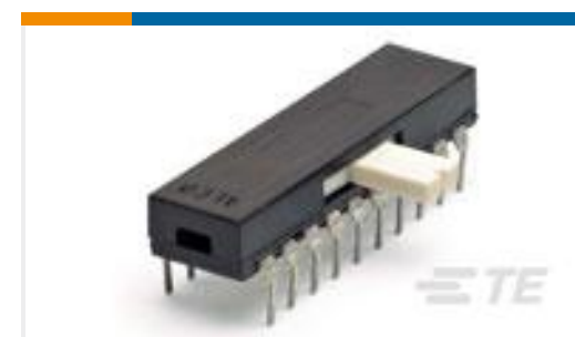
TE 产品编号2-1825010-5 ASE4304=4P3T AUTOSLIDE