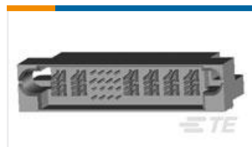
TE 产品编号1888114-3 MBXL R/A HDR 2P+16S+4P