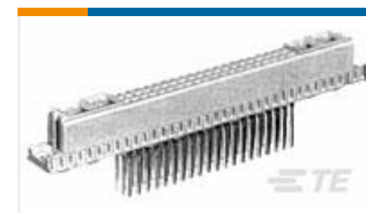
TE 产品编号5148420-5 ASSY,RECPT,TYPE M,EUROCARD,L-F