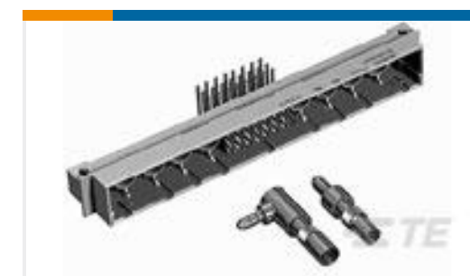
TE 产品编号5148414-5 ASSY,PIN,R.A.,TYPE M,EUROCARD,L-FREE,24+