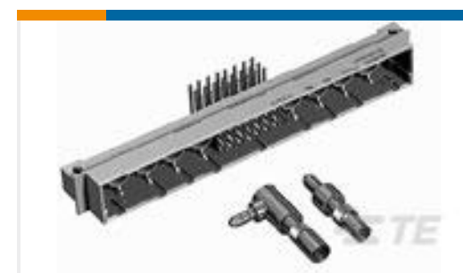
TE 产品编号5148412-5 ASSY,PIN,R.A.,TYPE M,EUROCARD,L-FREE,60+