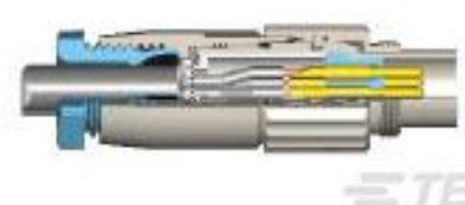
TE 产品编号1-1437719-8 T01-0550-P04-MALE PLUG CONNECTOR SOLDER