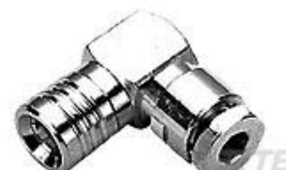
TE 产品编号1-1478008-0 SMB R/A Plg PS 50Ohm Gold Pltd RG174A/U,