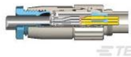
TE 产品编号 1-1437719-8 T01-0550-P04-MALE PLUG CONNECTOR SOLDER