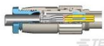
TE 产品编号1-1437719-5 T01-0550-P03-MALE PLUG CONNECTOR SOLDER