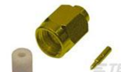
TE 产品编号1-1478904-0 SMA STR PLG DS RG405 GSS