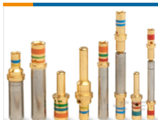
TE 产品编号 ZPF0000000000000358 006-0937-12 A