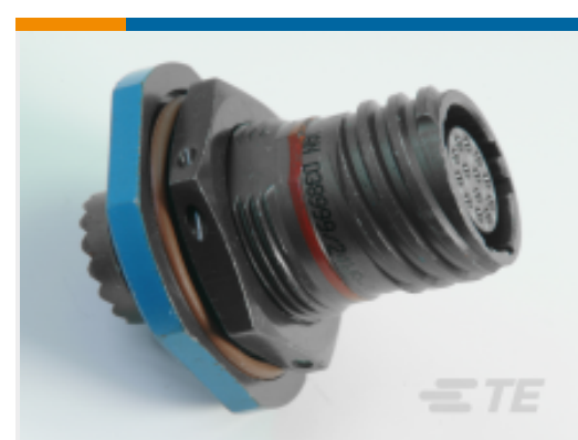
TE 产品编号 YDTS24Z17-99PNV001 RECP ASSY