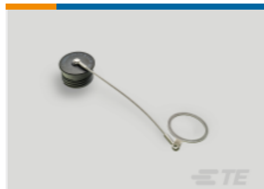
TE 产品编号YDTS32Z11NV0010000 CAP ASSEMBLY