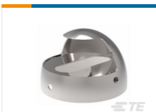
TE 产品编号993693-000 IR-500-39-RG-9-REFLECTOR