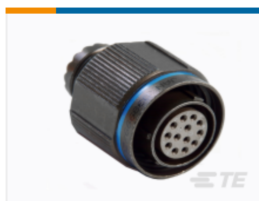
TE 产品编号 CAT-D38999-DTS18V Straight Plug: D38999, 17-06 Insert, Electroless Nickel Plating