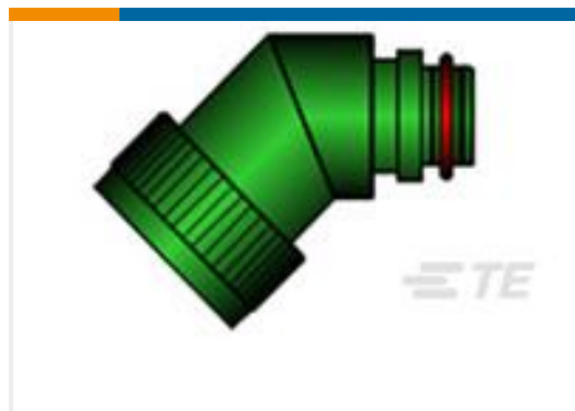
TE 产品编号EG1602-000 TX15AZ45-0804