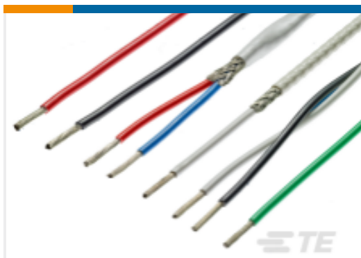
TE 产品编号262172-001 81044/6-14-2