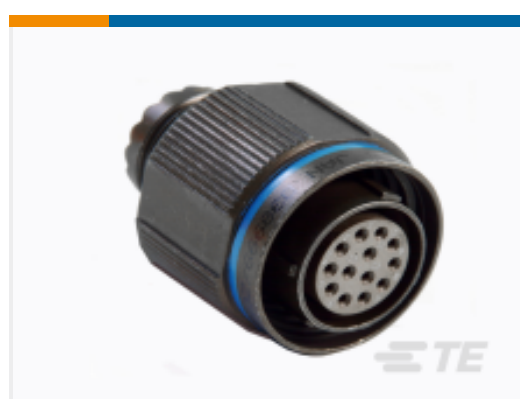
TE 产品编号 CAT-D38999-DTS18X Straight Plug: D38999, 17-26 Insert, Electroless Nickel Plating