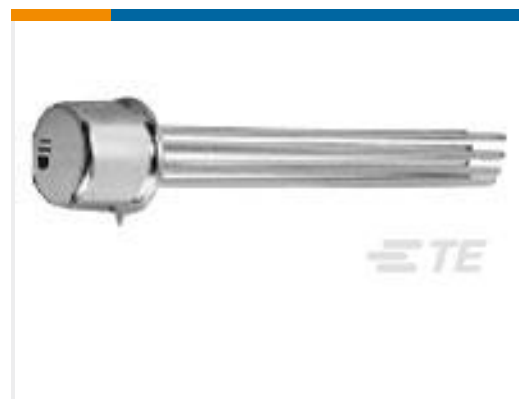
TE 产品编号1617119-5 J1MAW-18XP = M39016/7-021P