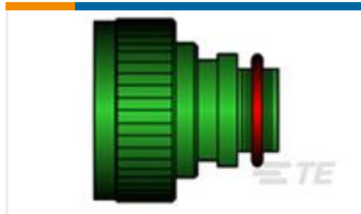
TE 产品编号661269-000 TXR21AB00-1605AI