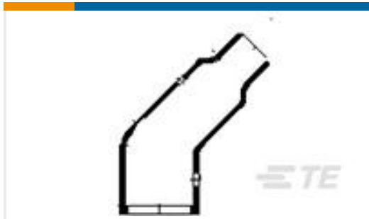
TE 产品编号642427-000 242A312-12-03-0