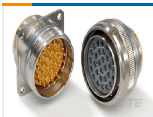
TE 产品编号ZPF000000000007174 983-ORS 08-98 PN