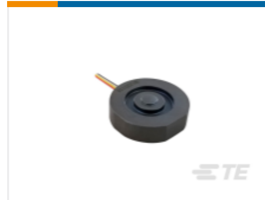
TE 产品编号20009605-09 FX293X-040B-0025-L