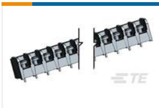
TE 产品编号4-1437658-0 8PCV-11-006=8PCV