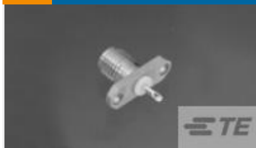
TE 产品编号1052928-1 2052 8003 92