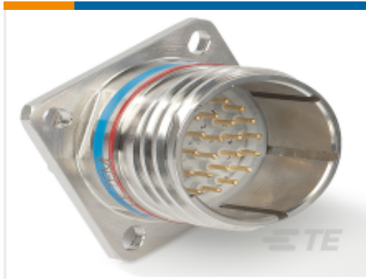
TE 产品编号YDTS20Z25-29PNV001 RECP ASSY