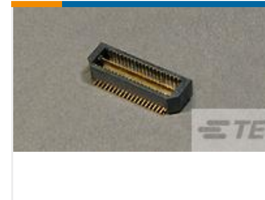
TE 产品编号6-1658013-1 MSB0.80PL5ASY040FL,GP,10,-TR