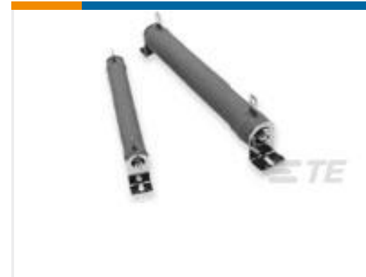
TE 产品编号3-1879447-2 TE 200W 390R 5% Bracket