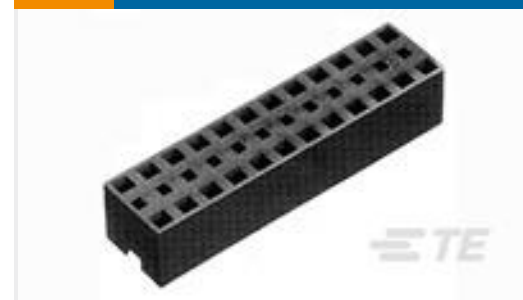
TE 产品编号390102-1 SHUNT, MULTI-POS 2X2 W/HANDLE