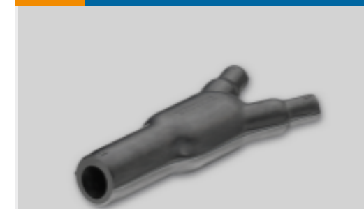
TE 产品编号163549-000 382A034-25/42-0