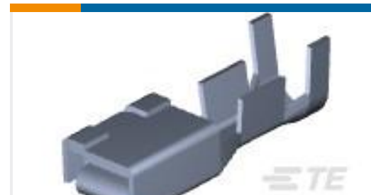
TE 产品编号179956-3 DYNAMIC D-5 REC CONT M FORM.