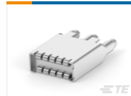
TE 产品编号1719101-1 PCB 9.5 TERMINAL SN