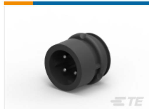
TE 产品编号1394324-2 2,5MM STIFTSTECK 4P