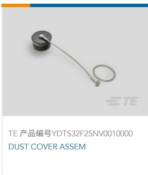
TE 产品编号YDTS32F25NV0010000 DUST COVER ASSEM