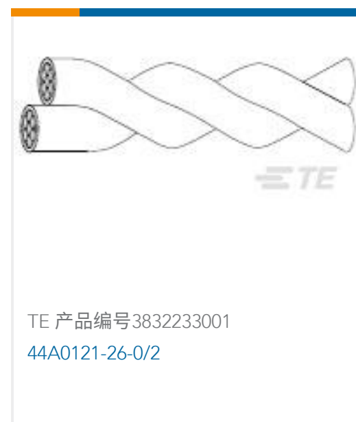
TE 产品编号3832233001 44A0121-26-0/2