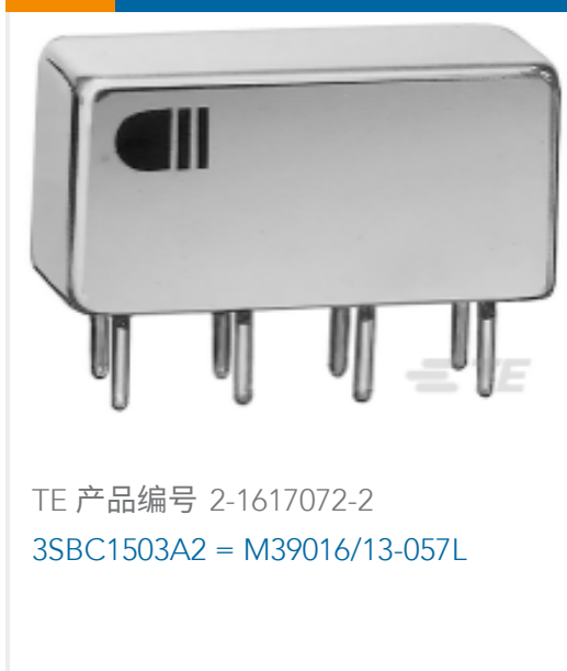
TE 产品编号 2-1617072-2 3SBC1503A2 = M39016/13-057L