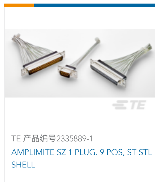
TE 产品编号2335889-1 AMPLIMITE SZ 1 PLUG. 9 POS, ST STL SHELL