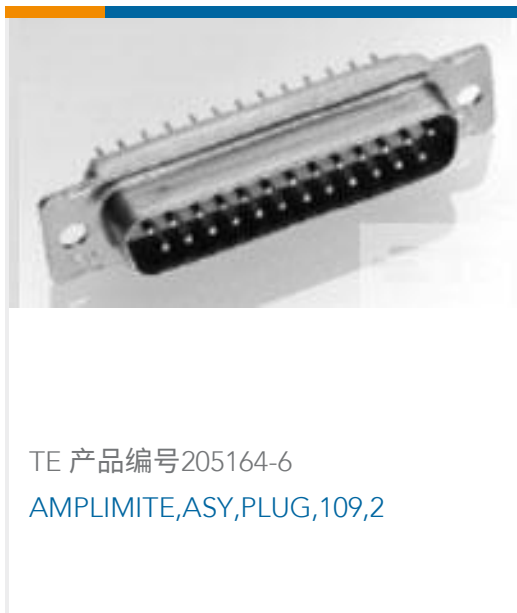
TE 产品编号205164-6 AMPLIMITE,ASY,PLUG,109,2