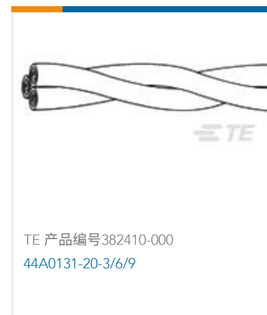
TE 产品编号382410-000 44A0131-20-3/6/9