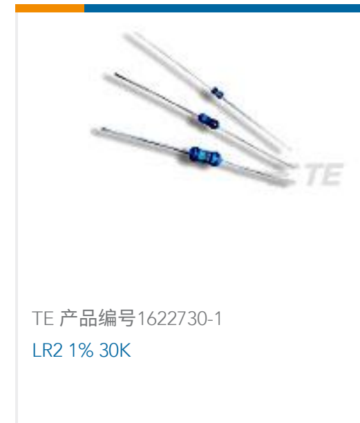
TE 产品编号1622730-1 LR2 1% 30K