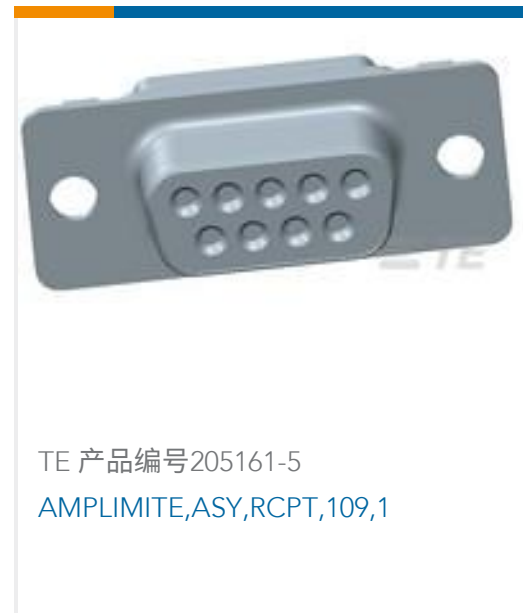
TE 产品编号205161-5 AMPLIMITE,ASY,RCPT,109,1