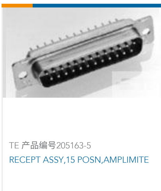
TE 产品编号205163-5 RECEPT ASSY,15 POSN,AMPLIMITE