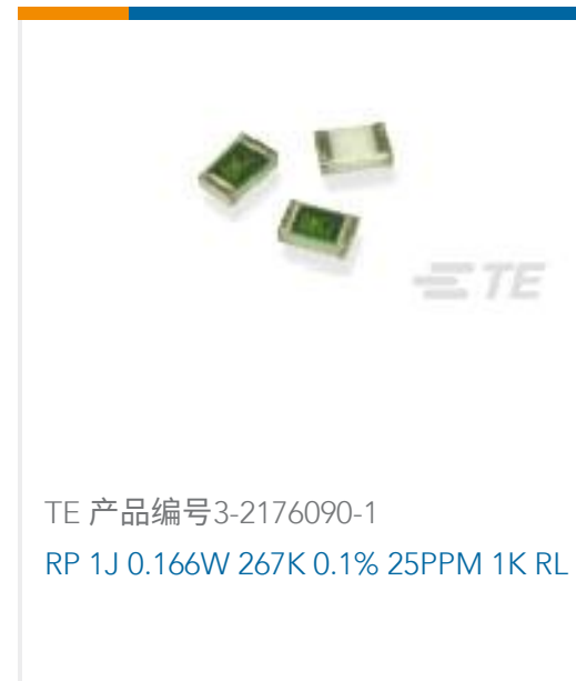
TE 产品编号3-2176090-1 RP 1J 0.166W 267K 0.1% 25PPM 1K RL