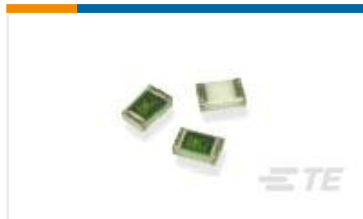
TE 产品编号 3-2176090-1 RP 1J 0.166W 267K 0.1% 25PPM 1K RL