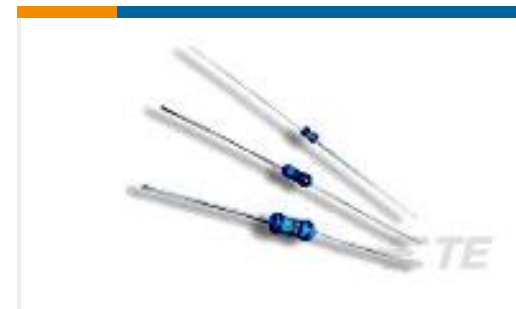
TE 产品编号 1622730-1 LR2 1% 30K