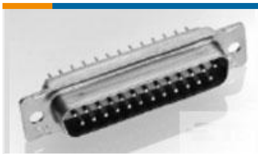
TE 产品编号 205164-6 AMPLIMITE,ASY,PLUG,109,2