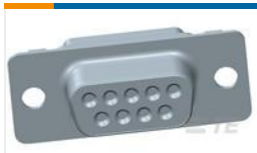
TE 产品编号 205161-5 AMPLIMITE,ASY,RCPT,109,1