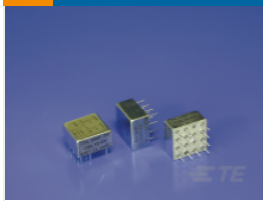
TE 产品编号 1-1617076-5 3SBH1148A2 = M39016/14-006M