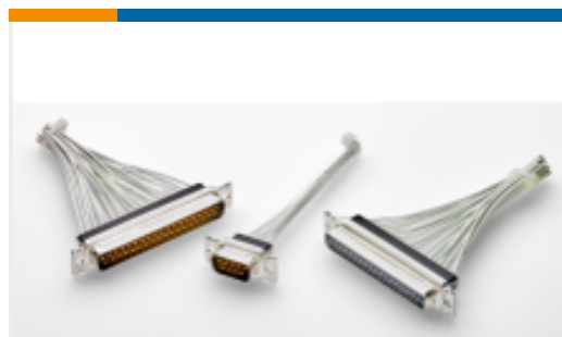
TE 产品编号 2335889-1 AMPLIMITE SZ 1 PLUG. 9 POS, ST STL SHELL