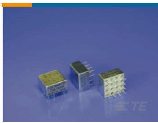
TE 产品编号 1-1617076-0 3SBH1138A2 = M39016/14-001M