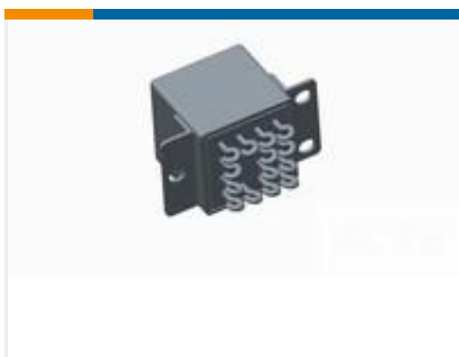
TE 产品编号 1617806-3 TD228-5000S=TDFO .5 SEC