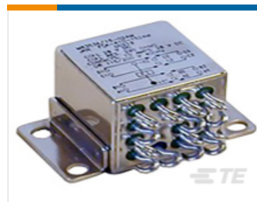
TE 产品编号 5-1617808-1 TD228-1803P=TDFO 10 SEC M83726 /28-1803P