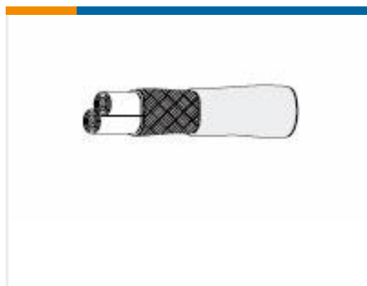
TE 产品编号 137317-000 55A1822-14-9/96-9CS2275