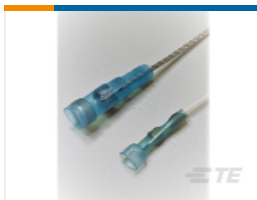
TE 产品编号 172711-000 D-183-0039