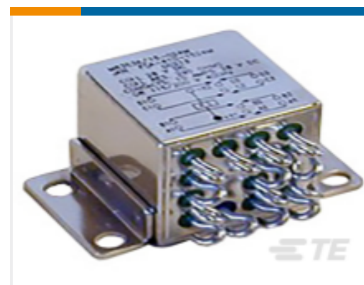
TE 产品编号 1617820-4 TD228-2403P 240SEC M83726/28-2403P