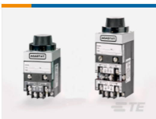
TE 产品编号 1423168-7 E7012AE004=RLY,NUC,ON,2P, 120VAC,200 SEC