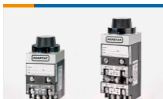
TE 产品编号1755170-1 7022OCIM=RLY,STD,OFF,2P,24V,15S,I, M