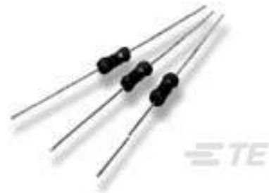
TE 产品编号1-1879350-6 RR01 5% R91 AMMO