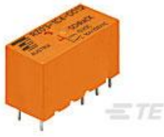
TE 产品编号1-1415899-7 RZ03-1A4-D024