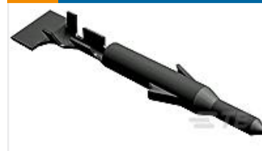
TE 产品编号1-770835-0 MINI UMNL PIN AU LF