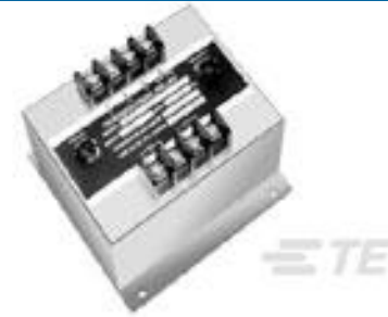
TE 产品编号1-1618113-5 WUVT3-230=WILMAR TIME DELAY --