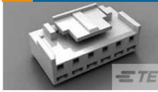
TE 产品编号1-1123722-8 3.96 EP PLUG HSG 8P(NATURAL)