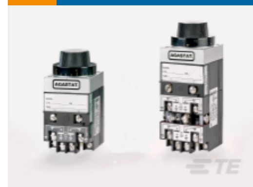
TE 产品编号1755170-1 7022OCIM=RLY,STD,OFF,2P,24V,15S,I, M