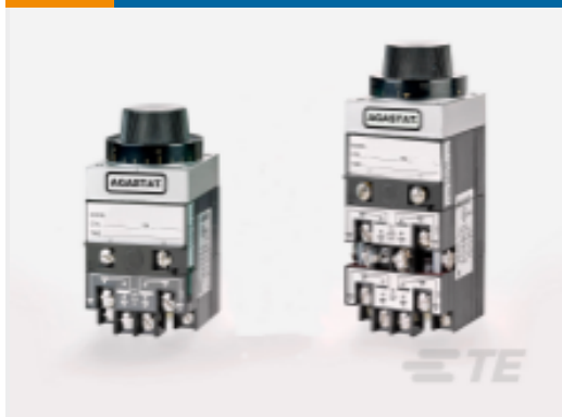
TE 产品编号 1423168-6 E7012AD004=RLY,NUC,ON,2P,120V