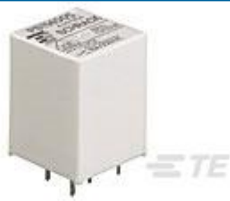
TE 产品编号 3-1415356-1 PBH34009