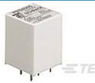
TE 产品编号 8-1415357-1 PBH34018