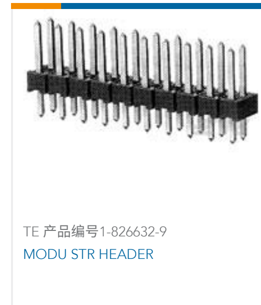
TE 产品编号1-826632-9 MODU STR HEADER