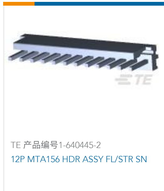
TE 产品编号1-640445-2 12P MTA156 HDR ASSY FL/STR SN