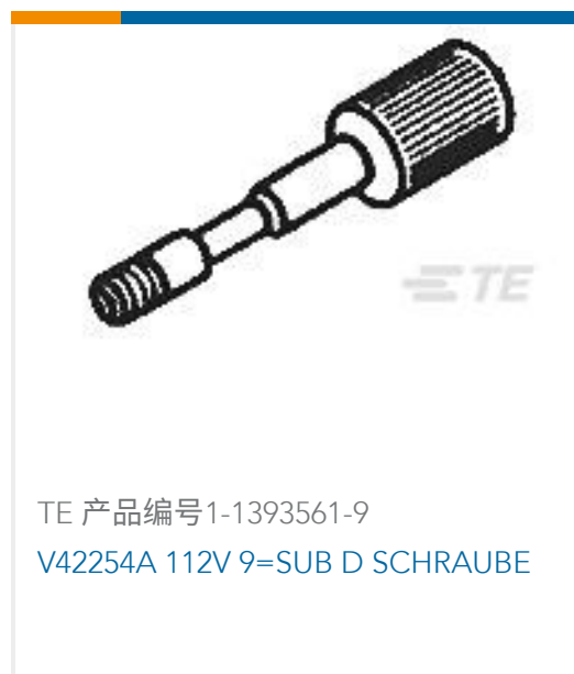
TE 产品编号1-1393561-9 V42254A 112V 9=SUB D SCHRAUBE