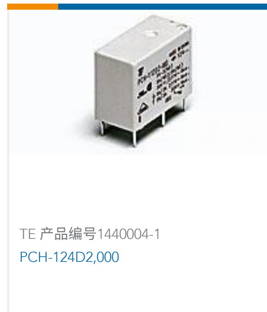
TE 产品编号1440004-1 PCH-124D2,000