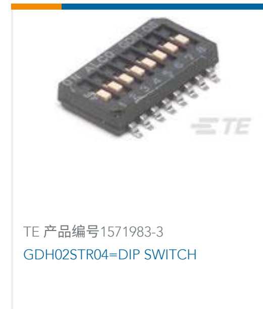
TE 产品编号1571983-3 GDH02STR04=DIP SWITCH