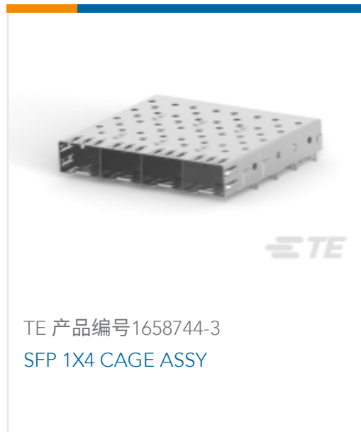
TE 产品编号1658744-3 SFP 1X4 CAGE ASSY