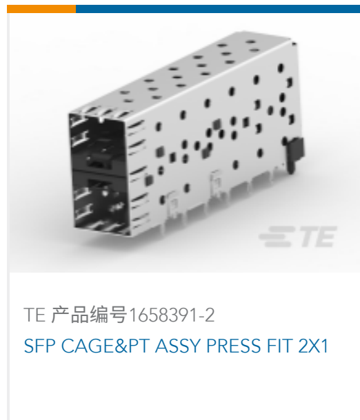
TE 产品编号1658391-2 SFP CAGE&PT ASSY PRESS FIT 2X1