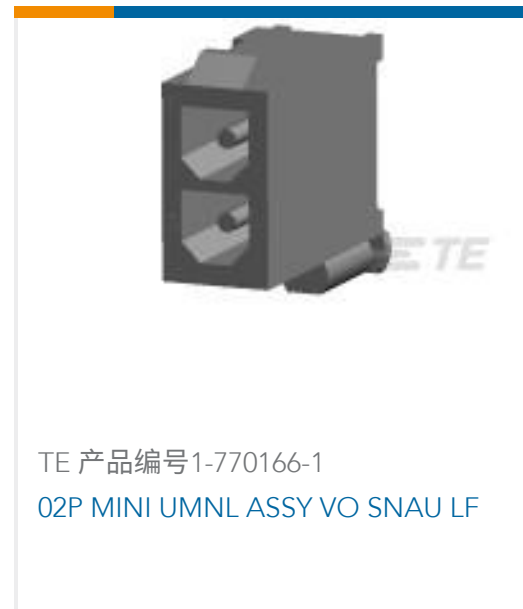
TE 产品编号1-770166-1 02P MINI UMNL ASSY VO SNAU LF