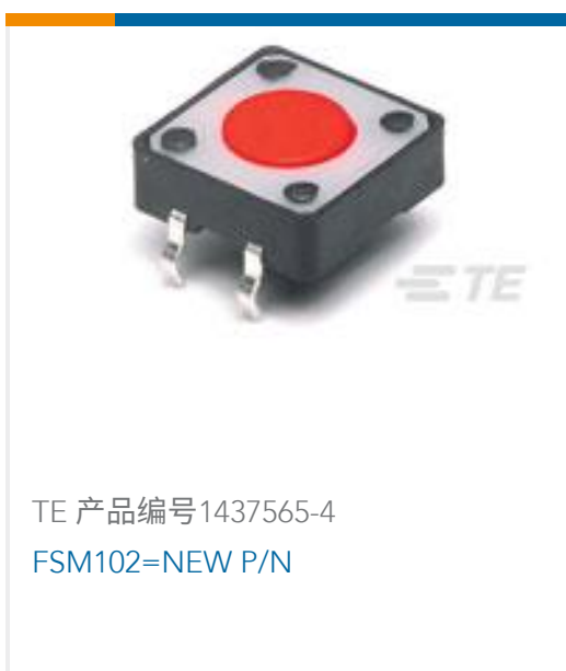
TE 产品编号1437565-4 FSM102=NEW P/N