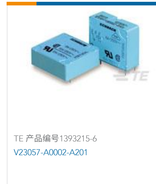
TE 产品编号1393215-6 V23057-A0002-A201