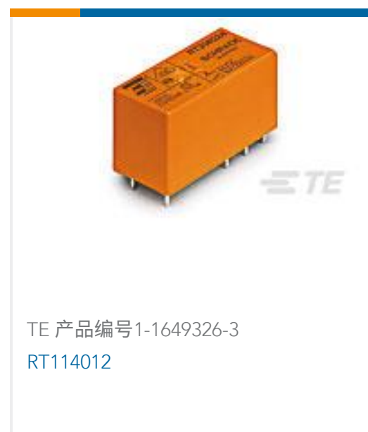
TE 产品编号1-1649326-3 RT114012