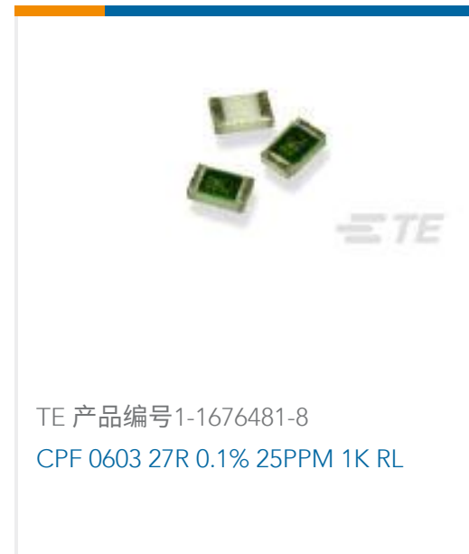
TE 产品编号1-1676481-8 CPF 0603 27R 0.1% 25PPM 1K RL