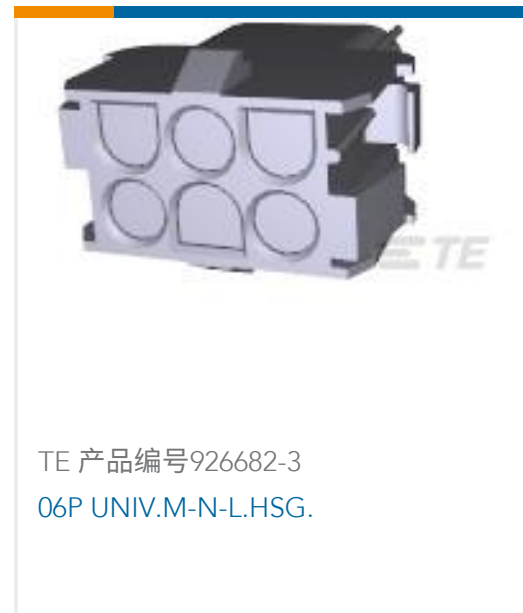
TE 产品编号926682-3 06P UNIV.M-N-L.HSG.