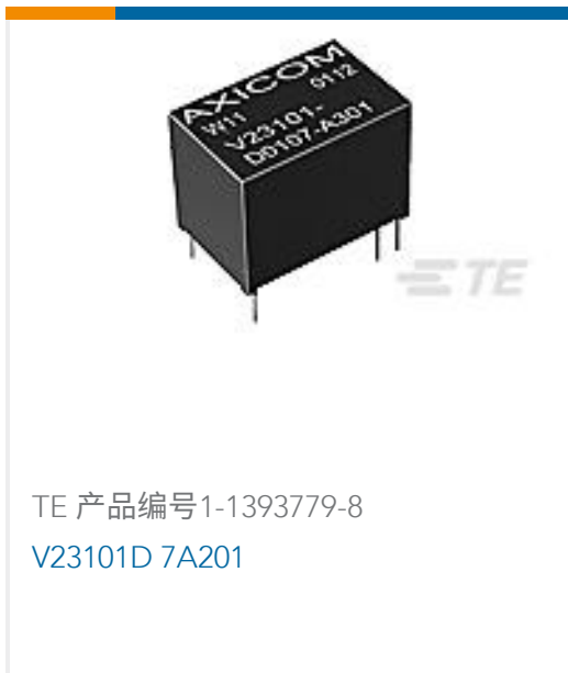
TE 产品编号1-1393779-8 V23101D 7A201