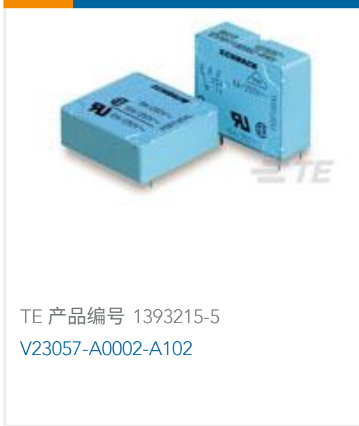
TE 产品编号 1393215-5 V23057-A0002-A102