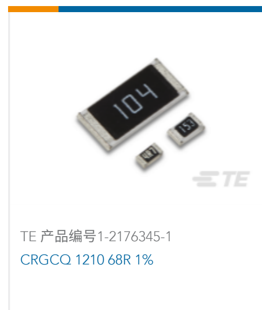
TE 产品编号1-2176345-1 CRGCQ 1210 68R 1%