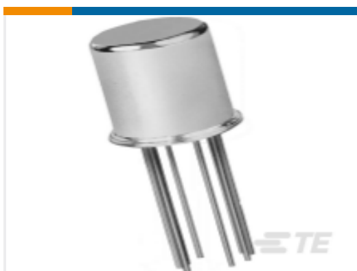
TE 产品编号1617166-8 JMAWT-5XM = M28776/1-013M