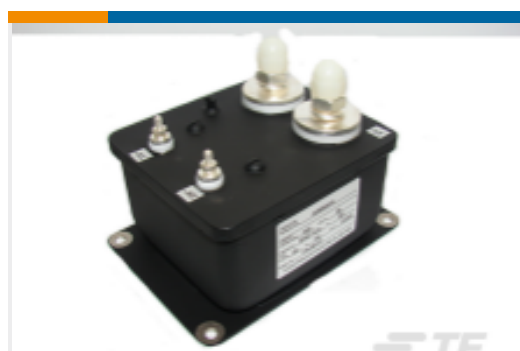
TE 产品编号1616977-6 AH600A1C=CONTACTOR SPST 600 AMPS HERM