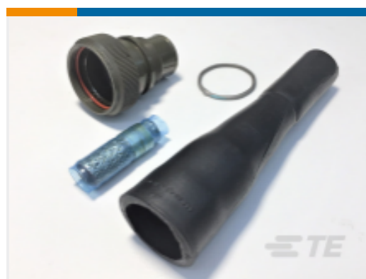
TE 产品编号893319-000 5428-10-561422