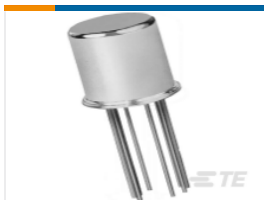
TE 产品编号4-1617351-7 JMSWD-26XL=M39016/16-020L