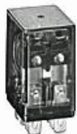
TE 产品编号 5-1393144-4 K10P-11D15-110=K10/K20