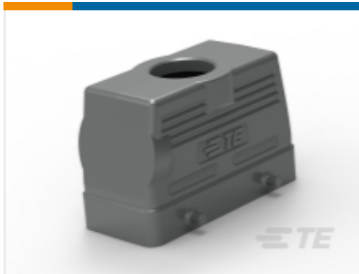
TE 产品编号T1220160132-000 H16B-TG-M32