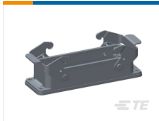
TE 产品编号T1410242000-100 H24B-AG