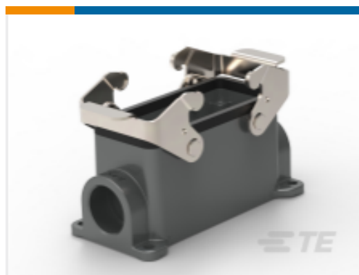
TE 产品编号T1440162125-000 H16B-SGR-M25