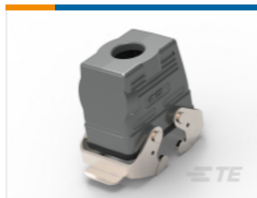
TE 产品编号T1710102120-000 H10B-TBF-M20