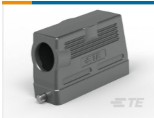
TE 产品编号T1330240129-000 H24B-TSH-RO-PG29