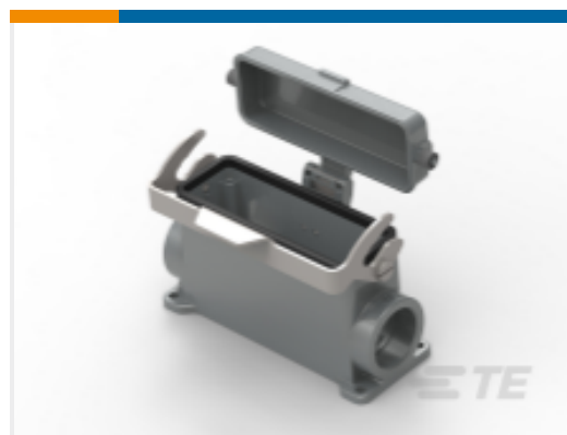
TE 产品编号T1660243229-000 H24B-SDRH-LB-2PG29