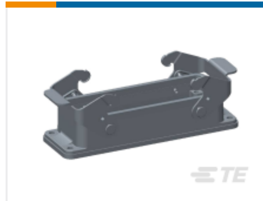
TE 产品编号T1410242000-000 H24B-AG