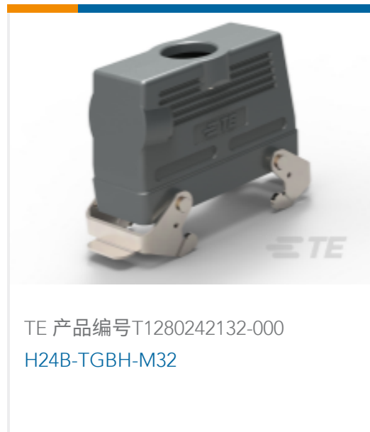
TE 产品编号T1280242132-000 H24B-TGBH-M32