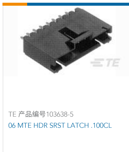
TE 产品编号103638-5 06 MTE HDR SRST LATCH .100CL