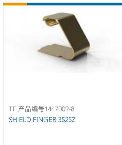
TE 产品编号1447009-8 SHIELD FINGER 3525Z