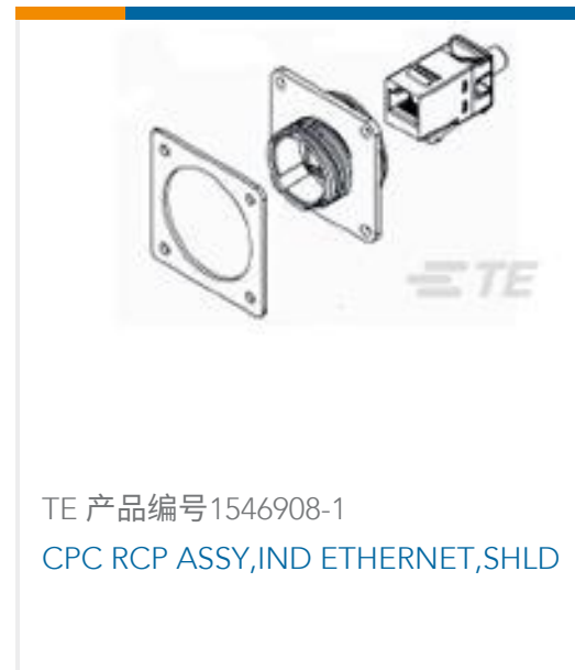
TE 产品编号1546908-1 CPC RCP ASSY,IND ETHERNET,SHLD