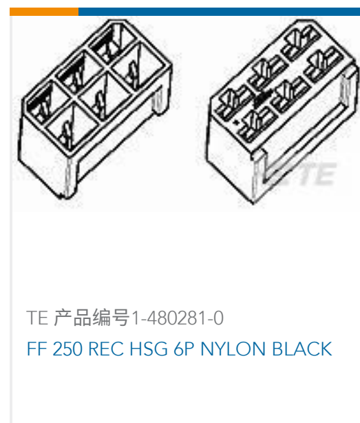
TE 产品编号1-480281-0 FF 250 REC HSG 6P NYLON BLACK