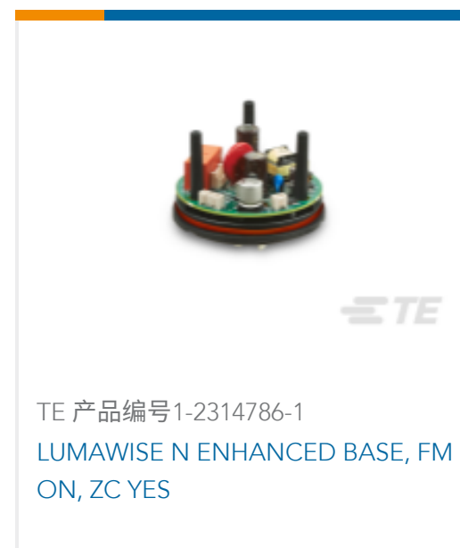
TE 产品编号1-2314786-1 LUMAWISE N ENHANCED BASE, FM ON, ZC YES