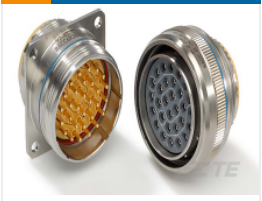
TE 产品编号 ZPF000000000109416 983-6R 16-24 PN-A246