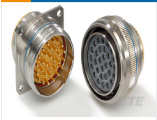
TE 产品编号 ZPF000000000205093 983-6K 10-05 PN-A246