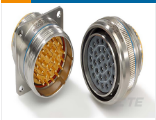
TE 产品编号 ZPF00000000033203 983-0S 12-12 P6 A246