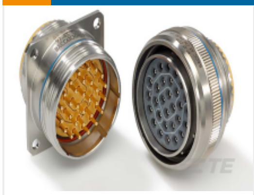
TE 产品编号 ZPF0000000007318 983-0S 10-05 P6 A246