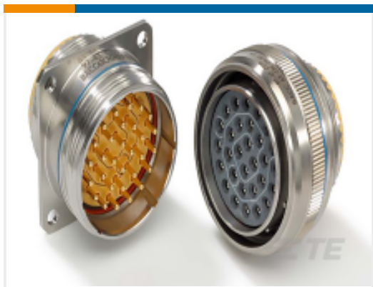
TE 产品编号 ZPF00000000110041 983-0A 10-05 PN-A5358