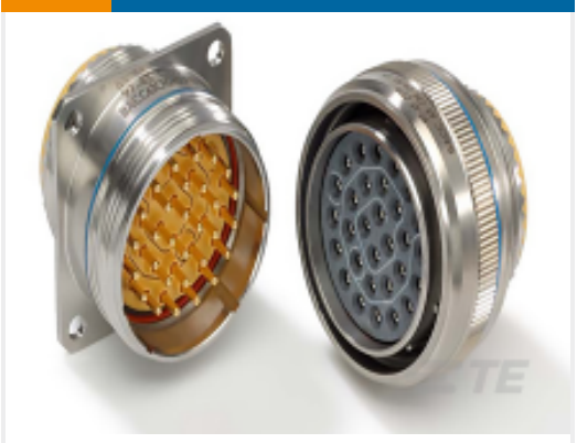
TE 产品编号 ZPF0000000007387 983-0S 16-24 P7 A246