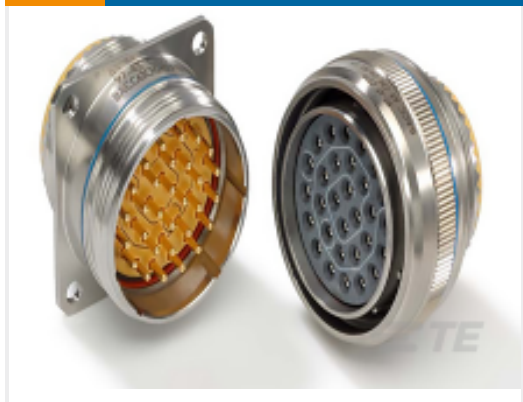
TE 产品编号 ZPF000000000200283 983-6S 12-12 P6 A246