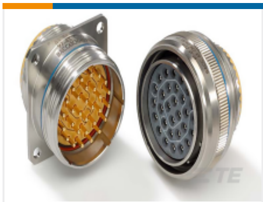
TE 产品编号 ZPF0000000007168 983-0RS 08-03 PN-A246