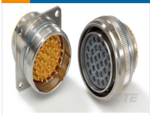
TE 产品编号 ZPF0000000007326 983-0S 10-05 PN-A246