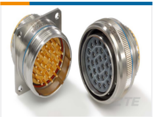
TE 产品编号 ZPF00000000107379 983-0RS 12-12 PN-A246