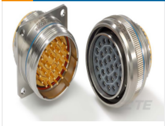
TE 产品编号 ZPF000000000105386 983-6RS 14-12 PN-B246