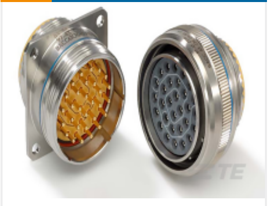
TE 产品编号 ZPF000000000200269 983-6S 10-05 PN-A246