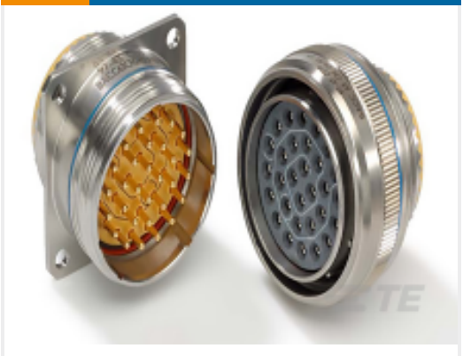
TE 产品编号 ZPF000000000200278 983-6S 20-41 PN-A246