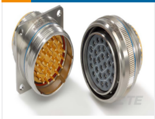
TE 产品编号 ZPF000000000203330 983-6A 12-12 PN-A246