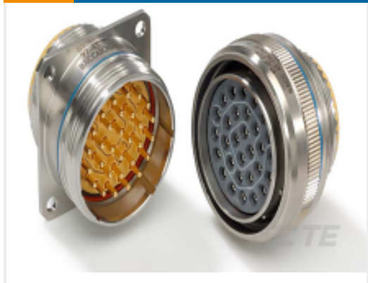
TE 产品编号 ZPF000000000105808 983-6R 18-31 PN-A246