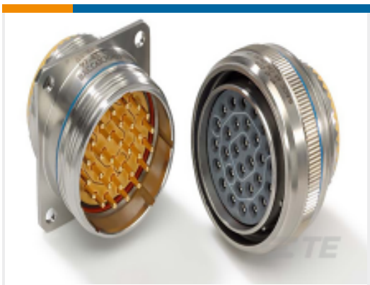
TE 产品编号 ZPF00000000100977 983-0RS 10-05 PN-A246