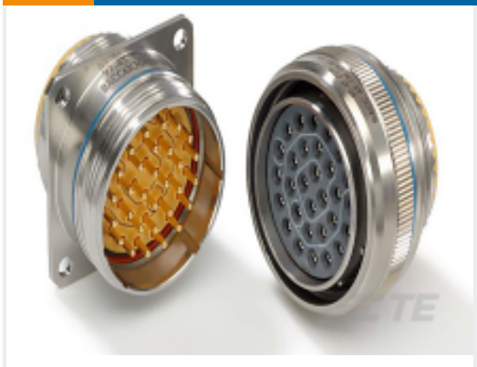
TE 产品编号 ZPF000000000200279 983-6S 18-31 PN-A246