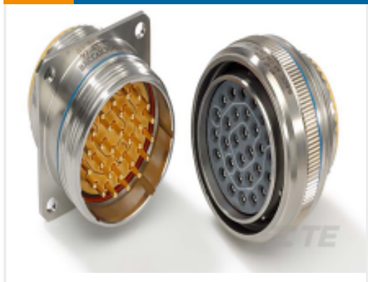
TE 产品编号 ZPF000000000200282 983-6S 12-12 PN-A246