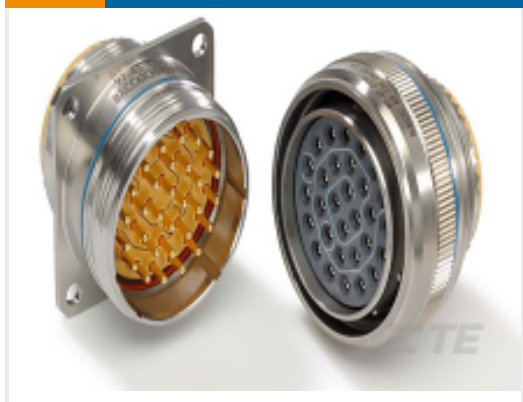
TE 产品编号 ZPF00000000033301 983-0S 16-24 PN-A246