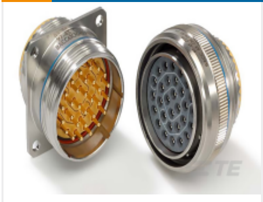
TE 产品编号 ZPF000000000203950 983-6RS 18-31 PN-A246