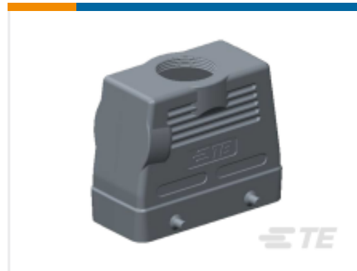
TE 产品编号T1240160132-000 H16B-TGH-M32