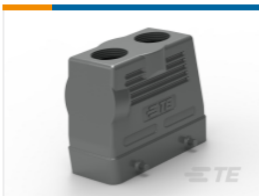
TE 产品编号T1240160225-000 H16B-TGH-2M25