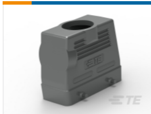
TE 产品编号T1240160121-000 H16B-TGH-PG21