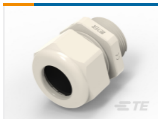
TE 产品编号T3209091201-000 HSK-P09G