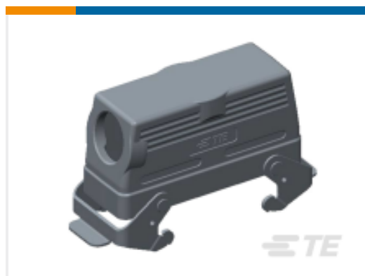
TE 产品编号T1250242121-000 H24B-TSB-PG21