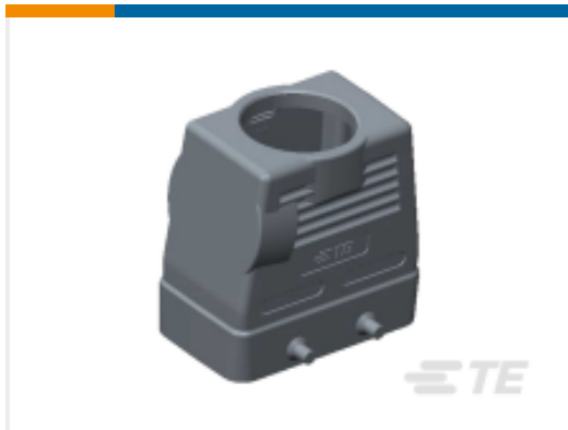
TE 产品编号T1240100129-000 H10B-TGH-PG29