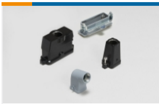
矩形连接器护罩和底座(1258)