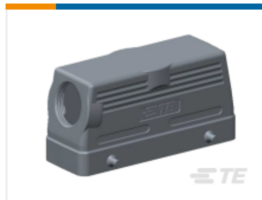
TE 产品编号T1210240125-000 H24B-TS-M25