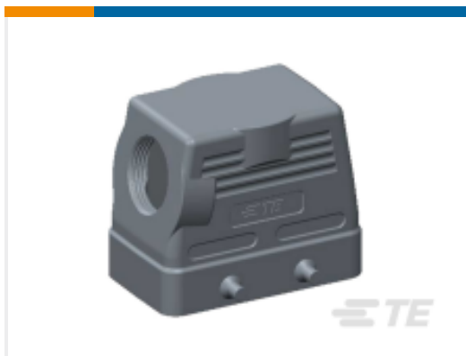
TE 产品编号T1210100125-000 H10B-TS-M25