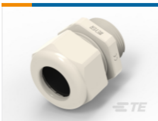
TE 产品编号T3209321222-001 HSK-M32G