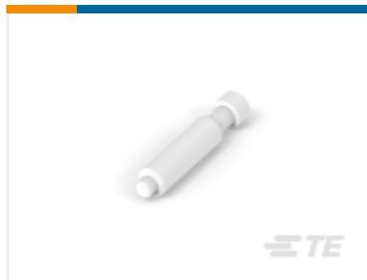
TE 产品编号T0931004524-000 CODING-PIN-HQ/HE