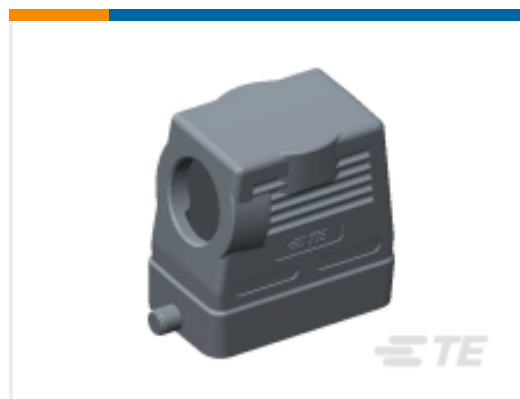
TE 产品编号T1330100132-000 H10B-TSH-RO-M32