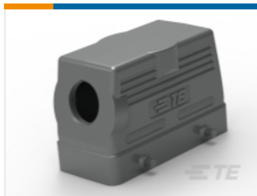
TE 产品编号T1210160125-000 H16B-TS-M25