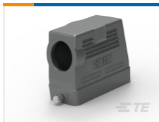
TE 产品编号T1330160132-000 H16B-TSH-RO-M32