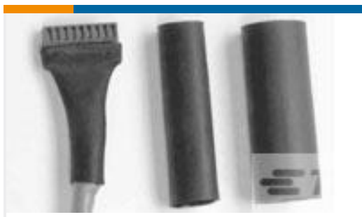
TE 产品编号7580142002 DWP-125-3/8-0-STK