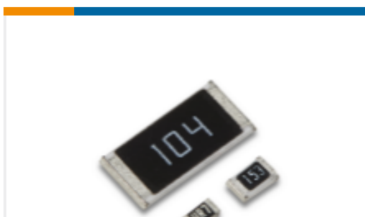
TE 产品编号2-2176339-6 CRGCO 0603 1K2 1%