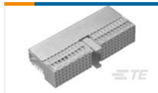
TE 产品编号1857994-1 Z-PACK/A F-HDR 110P, EON