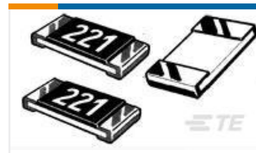
TE 产品编号1-2176230-7 3522 18R 5% 3W