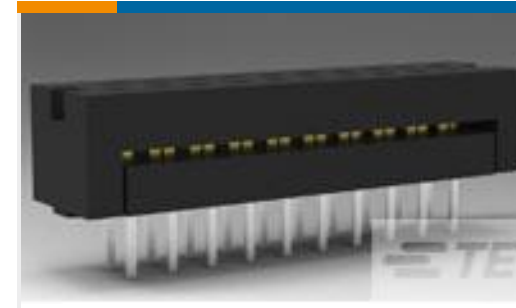
TE 产品编号2-746610-3 024 DIP PLUG 100CL TIN