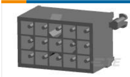
TE 产品编号1-770190-1 15P MINI UMNL ASSY VO SNAU LF