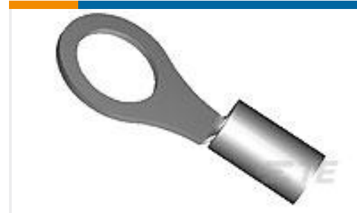
TE 产品编号184204-1 DG 22-16COM 22-18MIL HT R 10