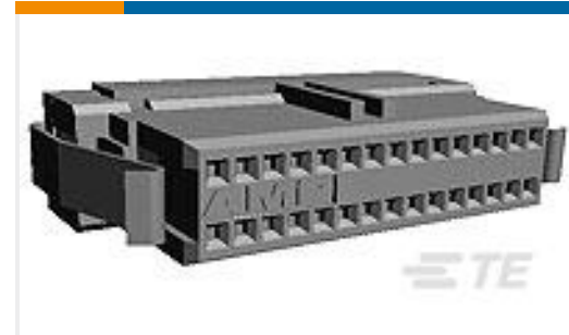
TE 产品编号2-111196-4 100 RCPT SYSTEM 50, LEAD FREE