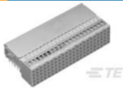
TE 产品编号 100145-1 Z-PACK/B F-HDR.125P