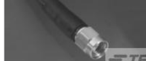
TE 产品编号 1051638-1 2031 5002 00