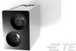
TE 产品编号 1-1469373-1 ATCA GUIDE MODULE RA FEMALE