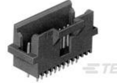
TE 产品编号 6-104666-3 34 SYSTEM 50 HDR DRST SHRD SN