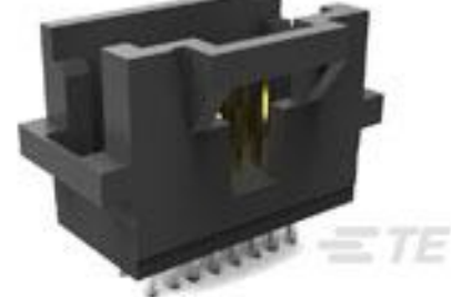
TE 产品编号 6-104068-3 34 SYSTEM 50 HDR DRST SHRD