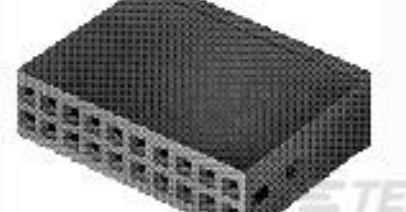
TE 产品编号 1-87133-1 12 LOCKING CLIP HSG DR .100CL