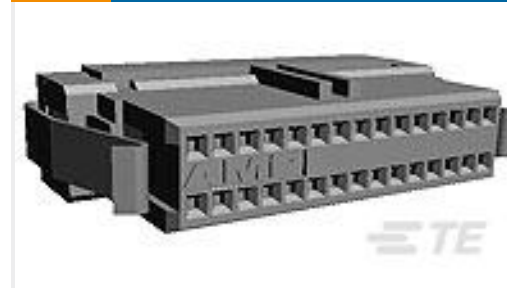
TE 产品编号 1-111196-8 20 RCPT SYSTEM 50, LEAD FREE