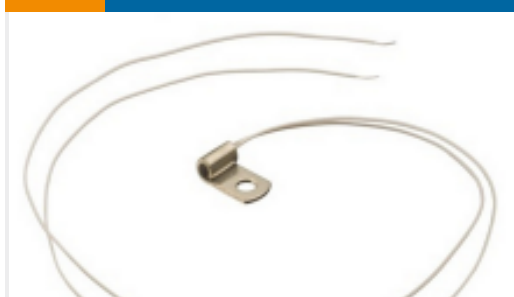
TE 产品编号 GA10K4D25 PRO2-PROBE