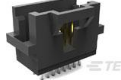
TE 产品编号 5-104068-1 20 SYSTEM 50 HDR DRST SHRD