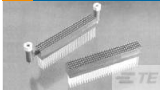
TE 产品编号 1375967-4 PC104 PLUS NONSTK NO STNDOFF