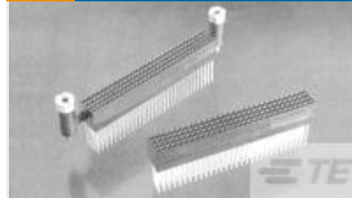
TE 产品编号 1375799-1 ASSY, 120 POS PC104 PLUS