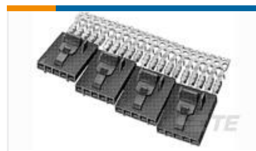
TE 产品编号103957-1 10X2 MTE RCPT SR LATCH .100CL