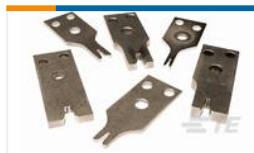
TE 产品编号2-2119582-6 Crimper, Insulation F Premium