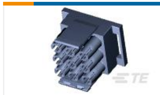
TE 产品编号2029370-1 09P UMNL-II REAR, TW-N-LK-CAP