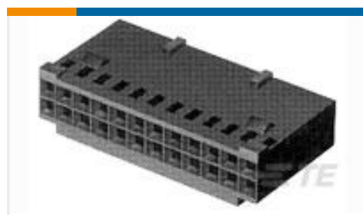
TE 产品编号1-87631-0 14 MODIV HSG DR MRKD .100 POL