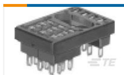
TE 产品编号 3-1393143-4 27E317=SOCKETS