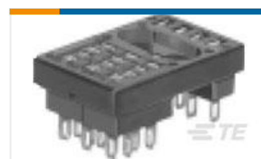
TE 产品编号 3-1393143-6 27E342=SOCKETS