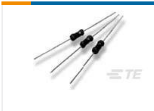
TE 产品编号4-1879352-7 RR02 5% 27R AMMO