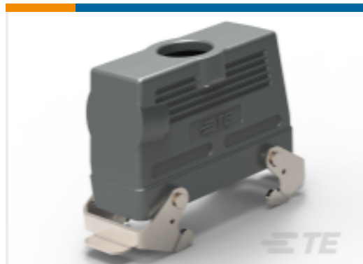
TE 产品编号T1280242132-000 H24B-TGBH-M32