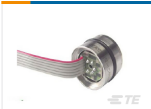
TE 产品编号154N-015G-R 15 PSIG RIBBON CABLE MV PRESSURE SENSOR