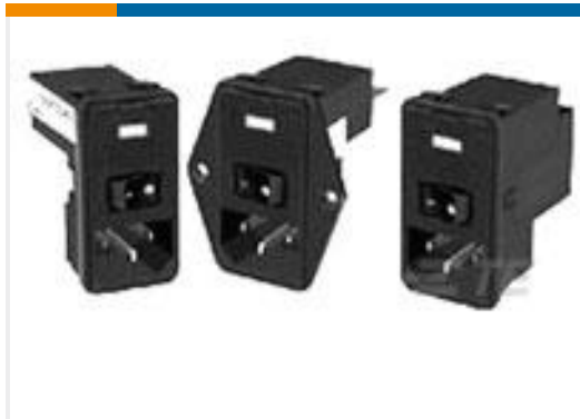
TE 产品编号1-6609106-4 PSOSSSH3A=C1072