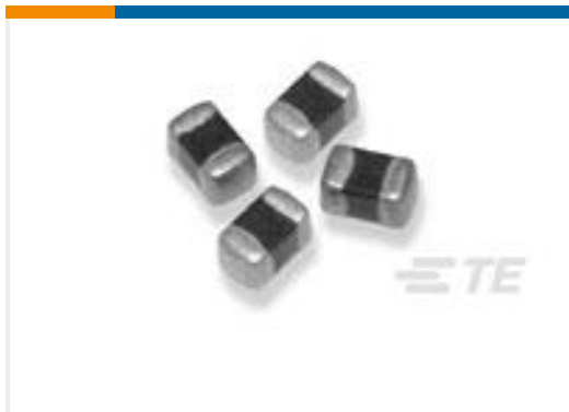
TE 产品编号2-1624116-6 BMB-A 0603 40R N8