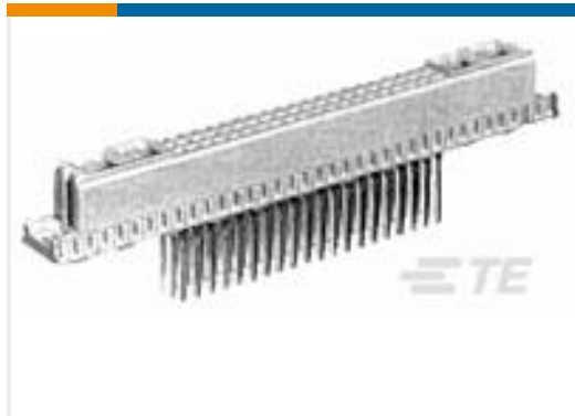
TE 产品编号148423-5 EURO TYPE M REC 42+6, THIN STK