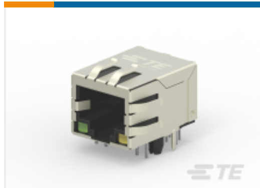
TE 产品编号2-2301994-3 RJ45 JACK INT.MAG. 1GB LED 1X1