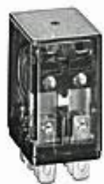
TE 产品编号 4-1393144-6 K10P-11A55-120=K10/K20