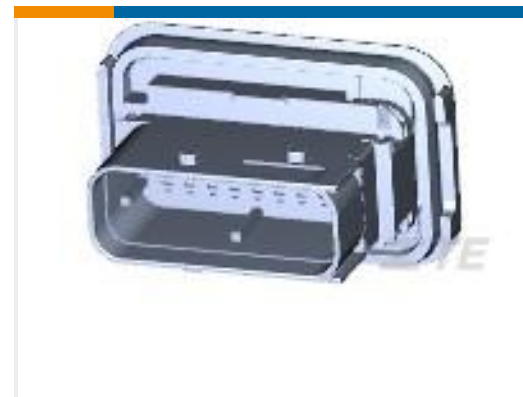
TE 产品编号2-1564532-1 15POS, MIXED, TAB HSG, ASSY