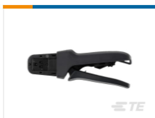
TE 产品编号DTT-20-03 CRIMP TOOL