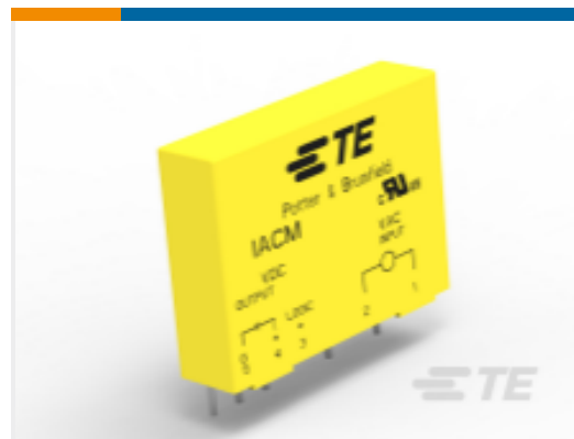
TE 产品编号 1-1393028-2 SLIM INPUT AC MOD,5V DC LOGIC-24VAC IP