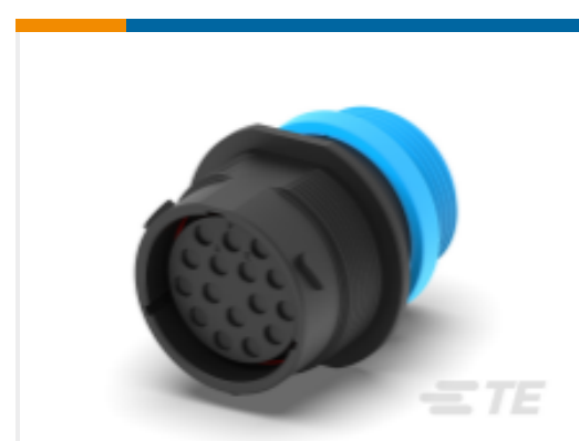
TE 产品编号HDP24-24-16SE-L015 REC, 16P, BLK, E, THD, 12, S