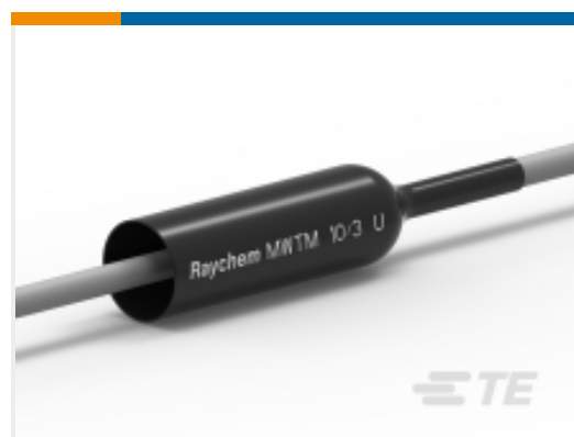
TE 产品编号834936-000 MWMT-10/3-100/S(S100)