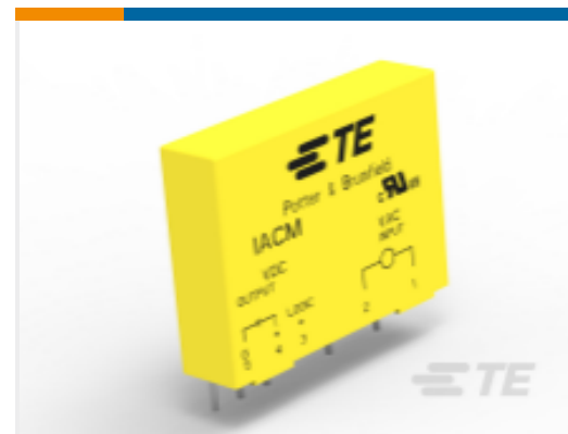
TE 产品编号 8-1393028-3 SLIM INPUT AC MOD,15V DC LOGIC-24VAC IP