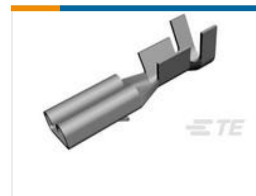
TE 产品编号160668-6 TERMINAL