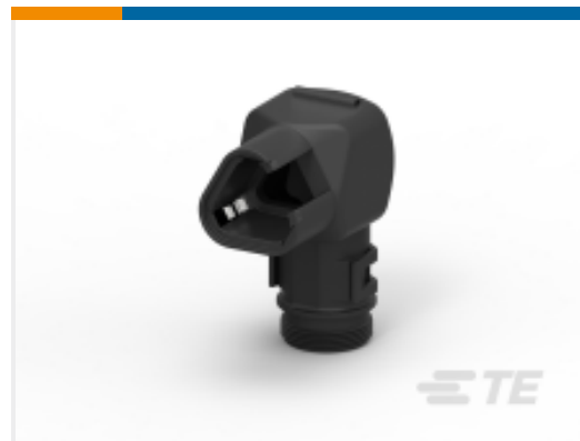
TE 产品编号1011-232-0305 BKSHL, 3P, BLK, PLG, RA, NW6/7.5/8.5/10