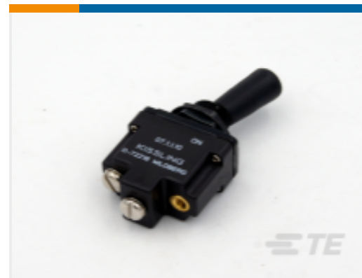
TE 产品编号K1007153 Toggle Switch 08-1-1-13