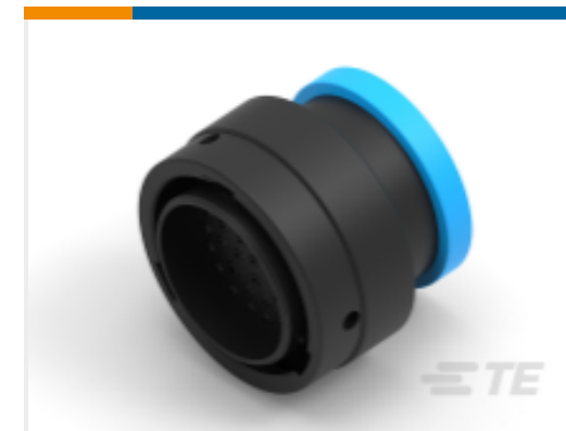
TE 产品编号YHDP26-24-35PEL017 PLG, 35P, BLK, E, RNG, 16/20, P