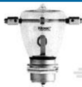
TE 产品编号 6-1618273-2 H-24=RELAY, VACUUM, SPST-NO