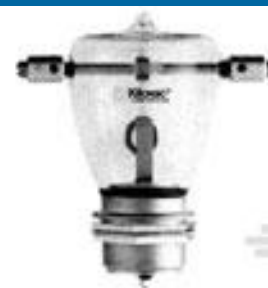
TE 产品编号 5-1618273-8 H-23/12VDC=RELAY, VACUUM, SPST