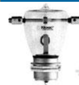
TE 产品编号 6-1618273-3 H-24/115VDC=RELAY, VACUUM, SPS