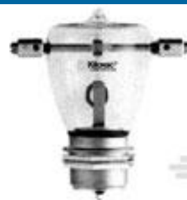
TE 产品编号 5-1618273-7 H-23/115VDC=RELAY, VACUUM, SPS