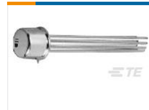
TE 产品编号1617119-5 J1MAW-18XP = M39016/7-021P