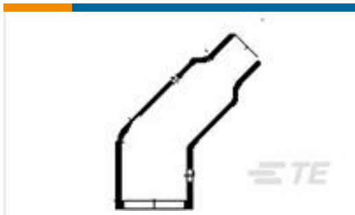
TE 产品编号642427-000 242A312-12-03-0