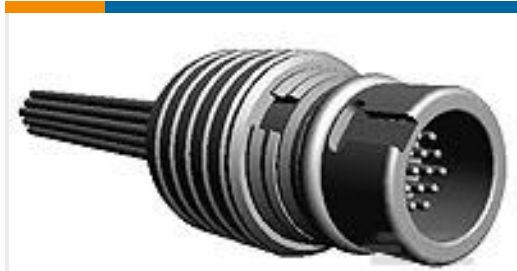
TE 产品编号 1589057-1 QCM019PC0DC012 = CIRCULAR