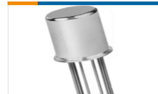
TE 产品编号1617164-7 JMACT-5XL = M28776/1-025L