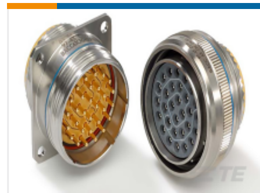
TE 产品编号ZPF000000000007174 983-ORS 08-98 PN