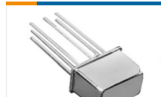
TE 产品编号1617147-5 JMGAP-26P = M39016/17-030P