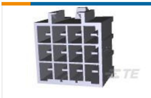
TE 产品编号179843-1 AMP POWER D/LOCK T/HDR ASY 12P