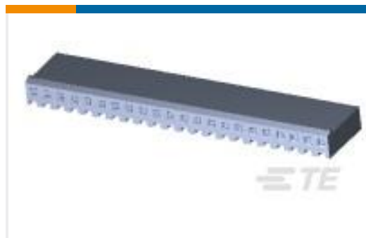
TE 产品编号2-640250-2 22P SL156 HSG W/LCK RAMP NATL