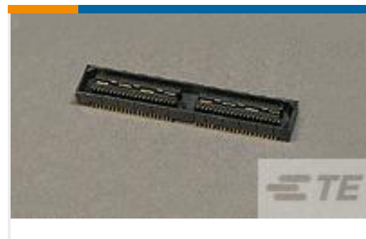
TE 产品编号1658012-2 MSB0.80RC-ASY080FL-,10,-TY