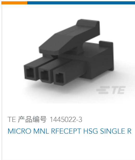
TE 产品编号 1445022-3 MICRO MNL RFECEPT HSG SINGLE R