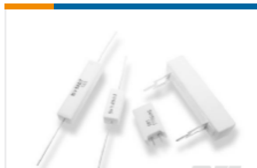
TE 产品编号2-1623788-2 线绕电阻器：垂直安装