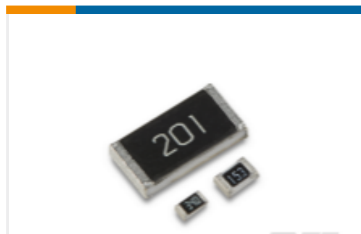
TE 产品编号1-2176330-6 CRGP 2010 180R 1%