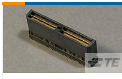
TE 产品编号1658016-2 MSB0.80PL16ASY080FL-,10,-TY