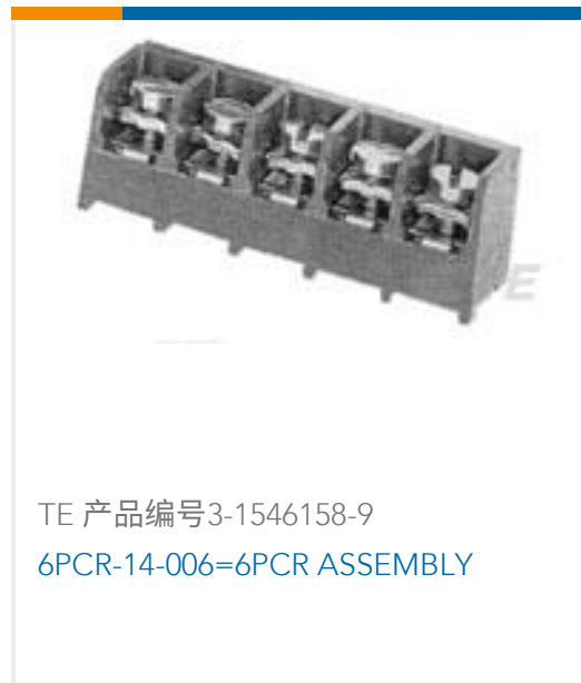
TE 产品编号3-1546158-9 6PCR-14-006=6PCR ASSEMBLY