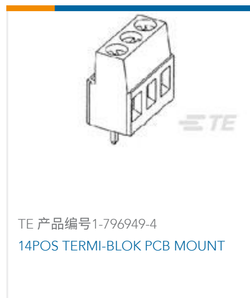
TE 产品编号1-796949-4 14POS TERMI-BLOK PCB MOUNT