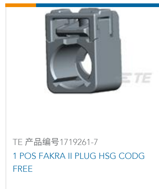
TE 产品编号1719261-7 1 POS FAKRA II PLUG HSG CODG FREE