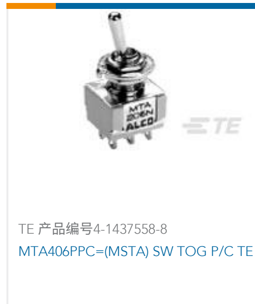
TE 产品编号4-1437558-8 MTA406PPC=(MSTA) SW TOG P/C TE