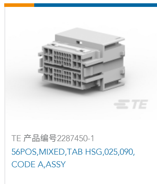
TE 产品编号2287450-1 56POS,MIXED,TAB HSG,025,090, CODE A,ASSY