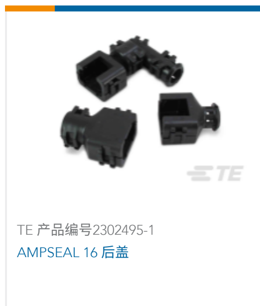
TE 产品编号2302495-1 AMPSEAL 16 后盖