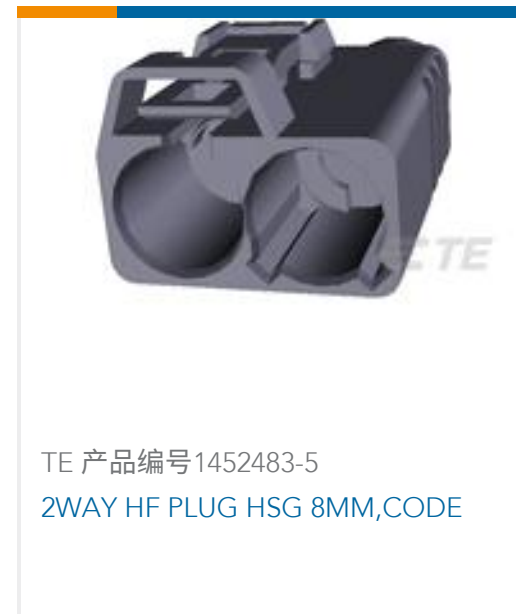
TE 产品编号1452483-5 2WAY HF PLUG HSG 8MM, CODE