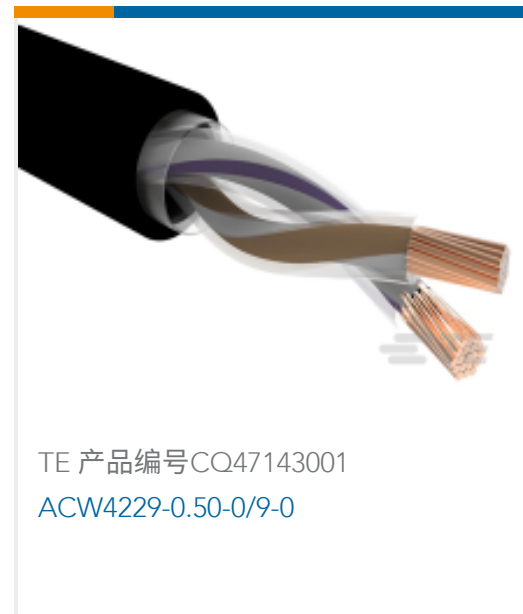
TE 产品编号CQ47143001 ACW4229-0.50-0/9-0