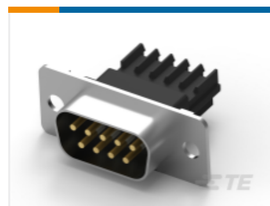
TE 产品编号 CAT-AM7-248H3 IDC D-Sub：插头组件，线对线，信号，2.77mm