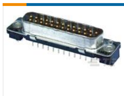
TE 产品编号 5-338309-2 9P.HDP20 PLUG ASSY