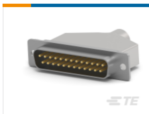
TE 产品编号 CAT-AM7-248H4 IDC D-Sub：连接器套件，插头，线对线，信号，2.77mm