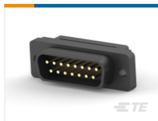
TE 产品编号 CAT-AM7-H3 IDC D-Sub：插头组件，小尺寸，信号，2.77mm