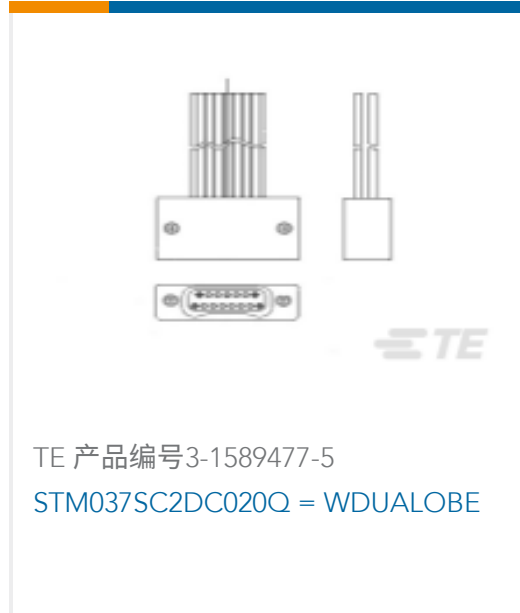
TE 产品编号3-1589477-5 STM037SC2DC020Q = WDUALOBE ASSY