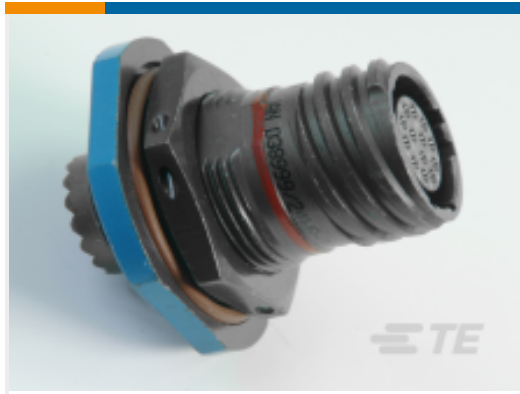
TE 产品编号YDTS24W25-20JNV001 RECP ASSY