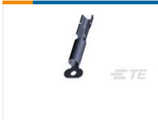
TE 产品编号42827-4 PIN .093 RECEPTACLE 24-18 AWG SST