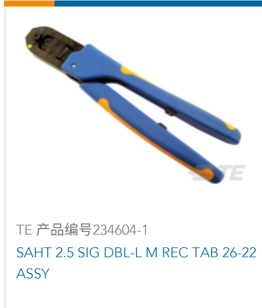
TE 产品编号234604-1 SAHT 2.5 SIG DBL-L M REC TAB 26-22 ASSY