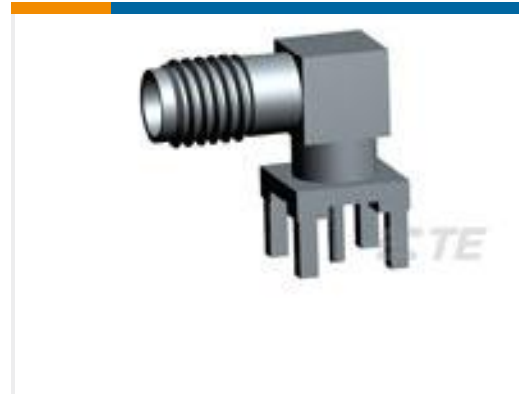
TE 产品编号1044570-1 SCD,1064 5005 00,SSMA