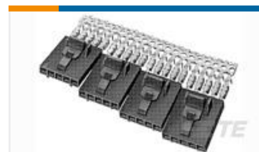
TE 产品编号5-103957-3 5X4 MTE RCPT SR LATCH .100CL