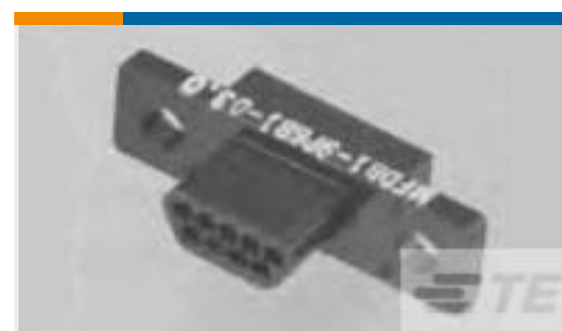
TE 产品编号4-1532020-8 095-0603-2030=MCDR3-B-9PS