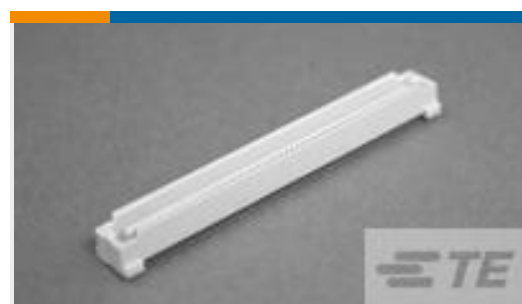
TE 产品编号5-5177986-4 0.8FH,P05H.5,100,30/Sn,TR,SC