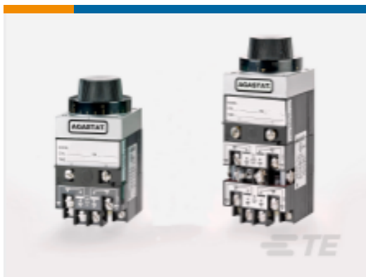
TE 产品编号 1-1423169-0 E7012PD004=RLY,NUC,ON,2P,125VD