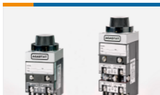
TE 产品编号1755170-1 7022OCIM=RLY,STD,OFF,2P,24V,15S,I,M