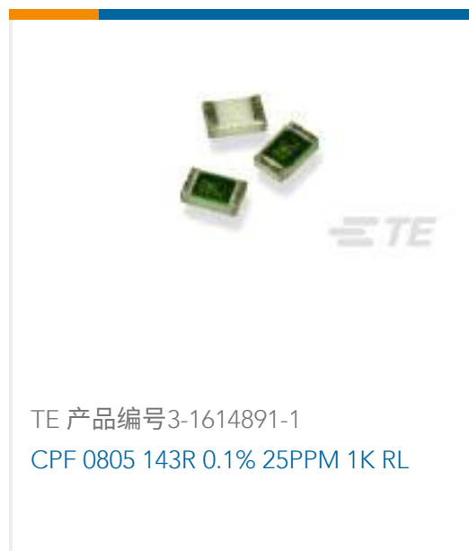
TE 产品编号3-1614891-1 CPF 0805 143R 0.1% 25PPM 1K RL