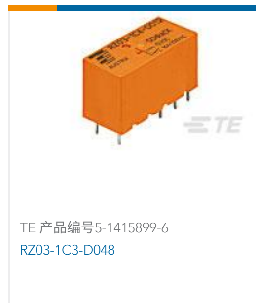
TE 产品编号5-1415899-6 RZ03-1C3-D048