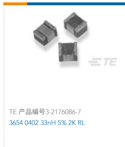
TE 产品编号3-2176086-7 3654 0402 33nH 5% 2K RL