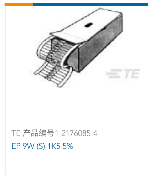
TE 产品编号1-2176085-4 EP 9W (S) 1K5 5%