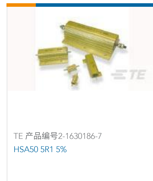
TE 产品编号2-1630186-7 HSA50 5R1 5%