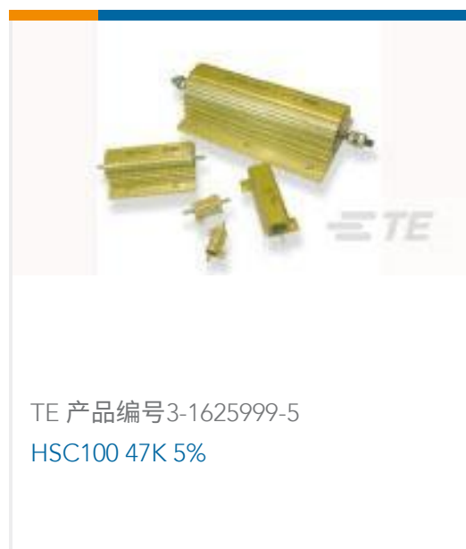
TE 产品编号3-1625999-5 HSC100 47K 5%