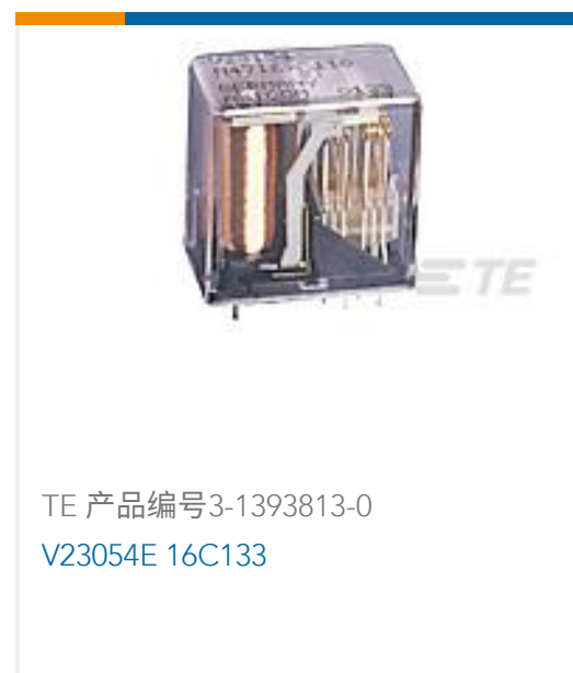
TE 产品编号3-1393813-0 V23054E 16C133