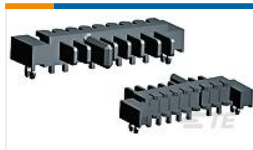
TE 产品编号1-1827654-1 2mm pitch Battery Plug Assy. 7Pos. H=4.0